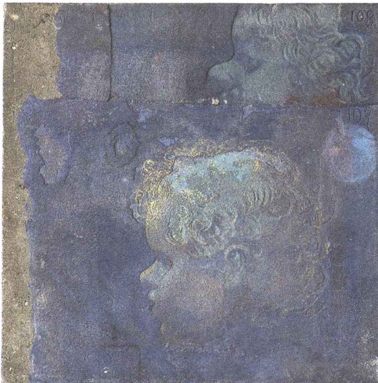
Entwurf für den Engelskopf am Regenbogen im Entrée der reformierten Kirche Othmarsingen, Platte mit Verputz, um 1921.