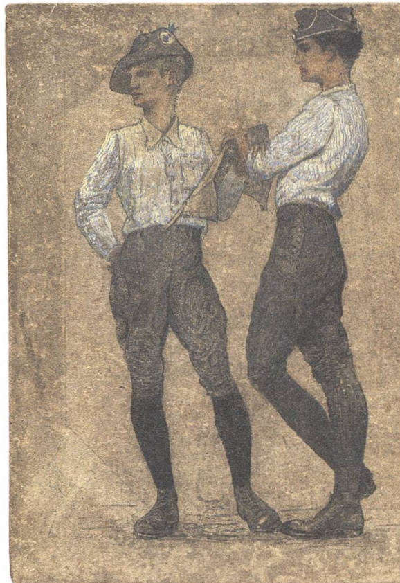
Entwurf für die Kadettenuniform zum Jugendfest, 1919.