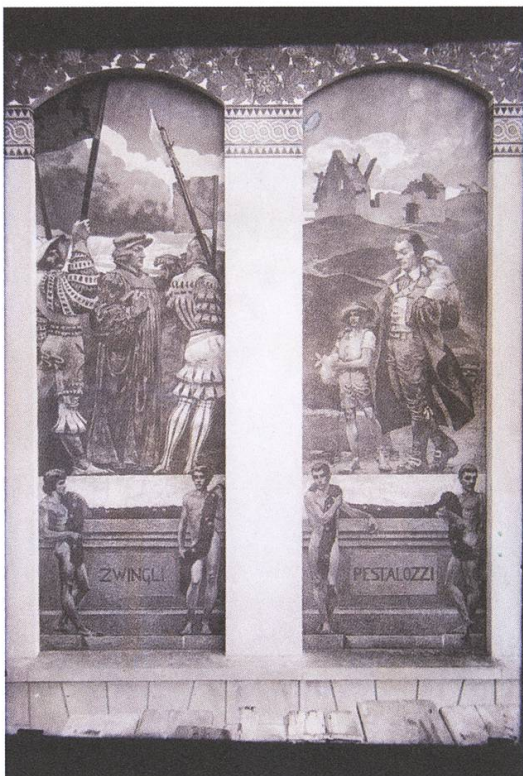
Zwei fertig gestellte Sgraffito-Bilder mit Pestalozzi und Zwingli am Schulhaus Angelrain. Fotoglasplatte, Aufnahme nach 1904.

Auffällig ist, dass die Anzahl der bis dato eruierten Arbeiten für den profanen wie den sakralen Kontext zahlenmässig ausgewogen sind. Religiöse Aspekte, mythologische Motive und historische Momente changieren und münden bestenfalls in einer mehrschichtigen Lesbarkeit mit übergeordneter Sinnhaftigkeit.