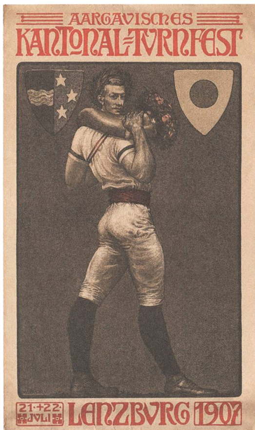
Plakatgestaltung für das Aargauische Kantonal-Turnfest in Lenzburg von 1907.