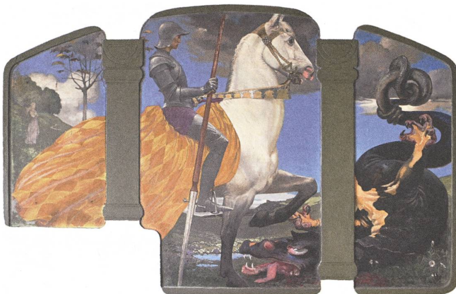
Georg der Drachentöter, Wandbild in der Eingangshalle der Villa Fischer, Wildegg, 1905.