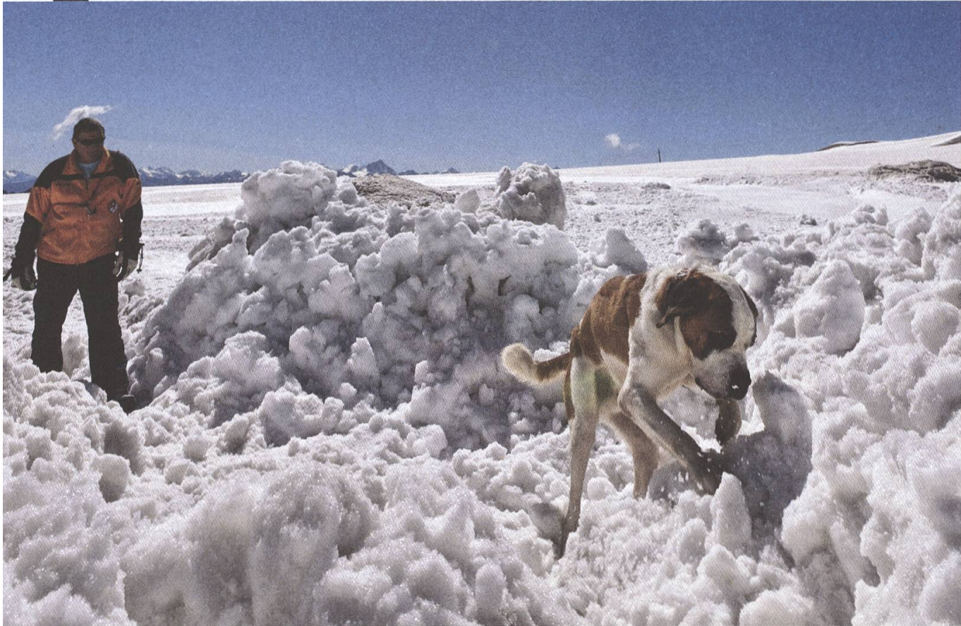
Weltkulturerbe: Expertise der Schweiz im Umgang mit der Lawinengefahr