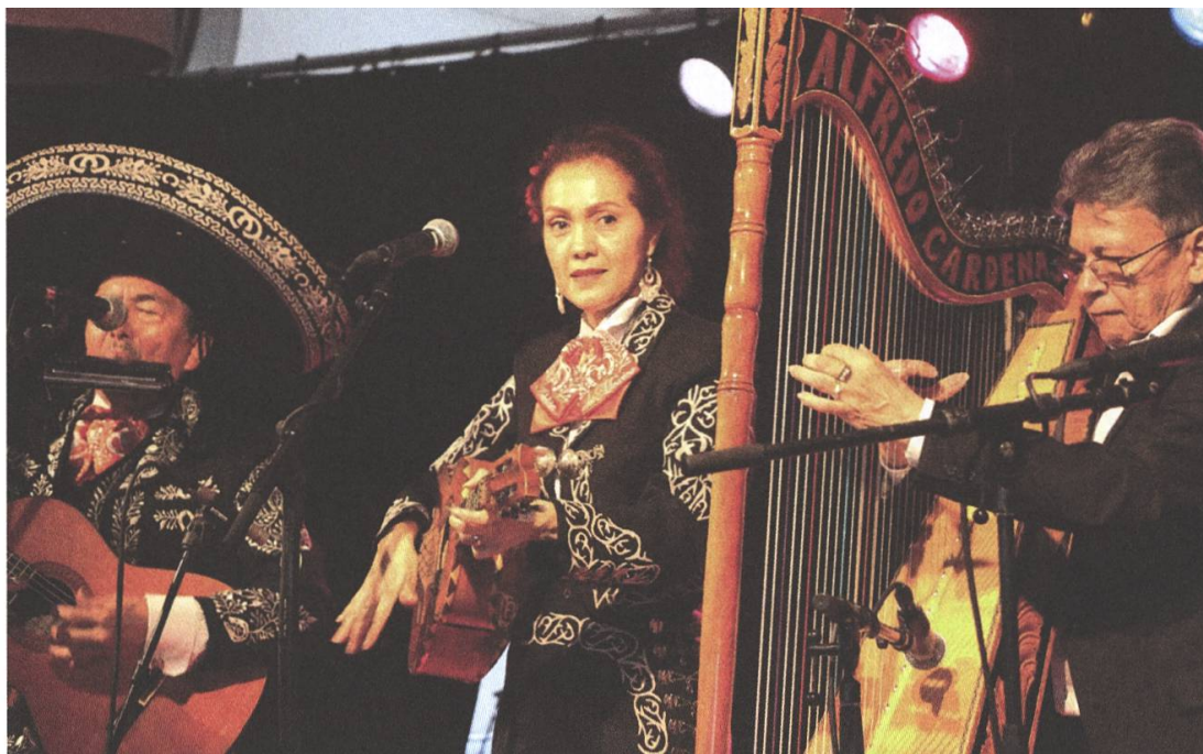
Musik aus aller Welt: El Mariachi Flores PW

So ging es einige Jahre weiter, die Bandmitglieder wurden älter und trennten sich schliesslich in Frieden. Der Metschgplatsch aber war für die vielen begeisterten Besucherinnen und Besucher nicht mehr wegzudenken. So erfand ich eine neue Metschgplatsch-Form (der Schreibende wechselt jetzt nahtlos zur Ich-Form über). Ich suchte Musikgruppen aus der Region, durchstöberte Übungskeller, überredete Musikformationen aller Richtungen zum Mitmachen. Nicht selten kam es vor, dass sich Gruppen ganz speziell für einen Metschgplatsch-Auftritt zusammenschlossen. Ein buntes Gemisch entstand, nicht nur auf der Bühne, sondern auch im Publikum. Das war einmalig und brachte eine ganz neue Qualität ins Städtchen. Ich reicherte die musikalischen Beiträge mit theatralischen Aktionen an und so wurde der Metschgplatsch mit der Zeit zu einem echten Pendant zum Jugendfest. Fast fünfzehn Jahre lang leistete ich diese Arbeit mit grosser Leidenschaft im Alleingang.