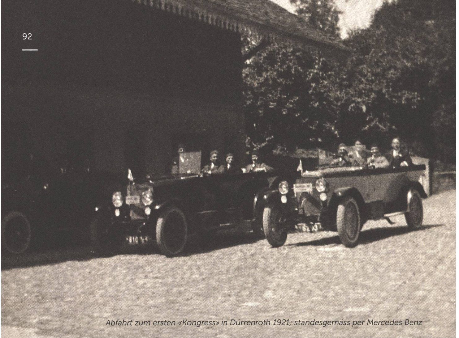
Abfahrt zum ersten «Kongress» in Dürrenroth 1921; standesgemäss per Mercedes Benz