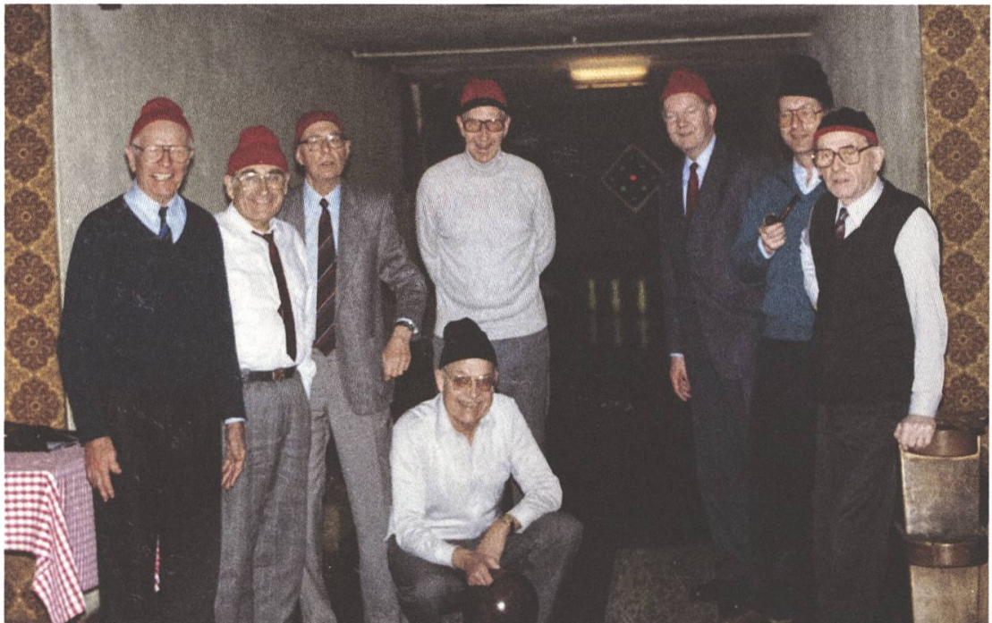
1989: Die praktischen Klubmützen konnten je nach Team-Zugehörigkeit von Schwarz auf Rot gewechselt werden

Die Mitglieder treffen sich ein- bis zweimal im Monat am Donnerstag-Abend zum Kegeln. Leider können sie ihrem Hobby nicht mehr in Lenzburg frönen. Zur Blütezeit des Kegeln in den 50er und 60er Jahren des letzten Jahrhunderts gab es in der Stadt noch mindestens sechs Kegelbahnen in den Hotels Ochsen, Haller und Krone. Heute müssen die Kegler froh sein, wenn sie eine Bahn in der Nachbarschaft finden. Nach der Schliessung der Lenzburger Bahnen spielte man eine Zeit lang im Bären Wildegg, später in der Burestube Seon; heute nutzen die Kegler die Bahn im «Güggel» in Dottikon.