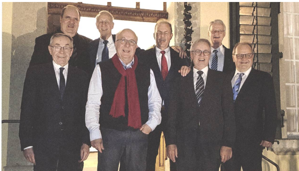
Die aktuellen Mitglieder an der Jubiläumsfeier 2021

dann ihren verdienten Preis in Form eines Blumenstrausses. Die Kassenablage des Klubs wird dagegen traditionsgemäss am 11. November, an Martini abgehalten. In früheren Jahren habe man zu diesem Anlass jeweils eine trockene Gans verzehrt. Heute seien die kulinarischen Ansprüche gestiegen, erklärt Steinmann.