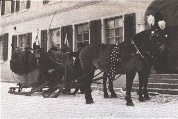
1941: Mit dem «Barnum-Schlitten» von Lenzburg nach Seengen

solche Charge zu übernehmen. Der Kongress überprüft auch, ob die Gebott-Sammlung noch aktuell ist und beschliesst über Anträge der Mitglieder. Bei Meinungsverschiedenheiten, entscheidet der Presidente kraft seines Amtes endgültig. Die allererste Clubreise führte die Kegler im Juni 1921 in den berühmten Bären nach Dürrenroth. Die Gruppe fuhr standesgemäss mit drei «Clubwagen» der Marke Mercedes Benz vor und präsentierte sich im Emmental in einheitlich feierlicher Kleidung. Auch heute bereisen die Kegler die Schweiz und mitunter auch das nahe Ausland, bis München, ins Rheinland, nach Vorarlberg oder ins Elsass, um sich kulinarisch verwöhnen zu lassen. Dreimal im Jahr – unter anderem beim Absenden – sind auch die Frauen zu den Anlässen eingeladen.