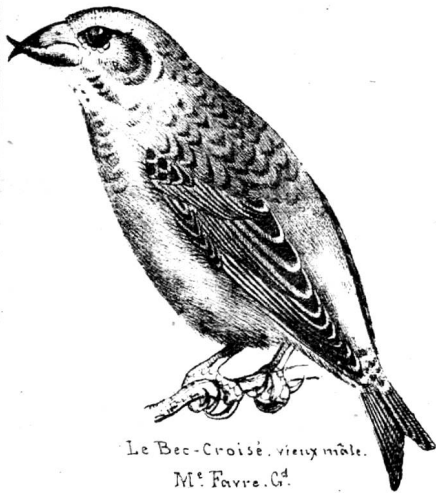
Le Bec-Croisé, vieux mâle. M e Favre. G d .