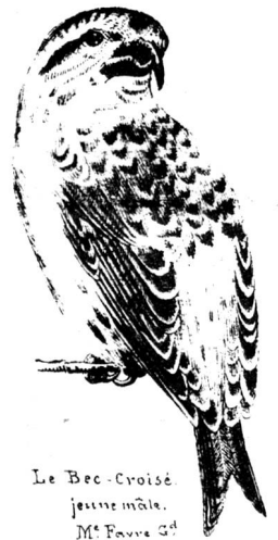
Le Bec-Croisé jeune mâle. M e Favre G d .

Apparition insolite de troupes nombreuses de becs-croisés dans les vergers du vignoble, pendant les 1 res semaines du mois d'août actuel, m'a porté à entreprendre, sur ces oiseaux, peu connus chez nous, quelques observations dont je confie les résultats au Flancon de Saignin . Je serais heureux d'attirer l'attention des Clubistes sur un animal dont les mœurs présentent des problèmes encore obscurs et qu'une observation attentive et persévérante parviendrait tôt ou tard à résoudre. Voilà encore un champ ouvert à l'activité des amis de l'histoire naturelle.