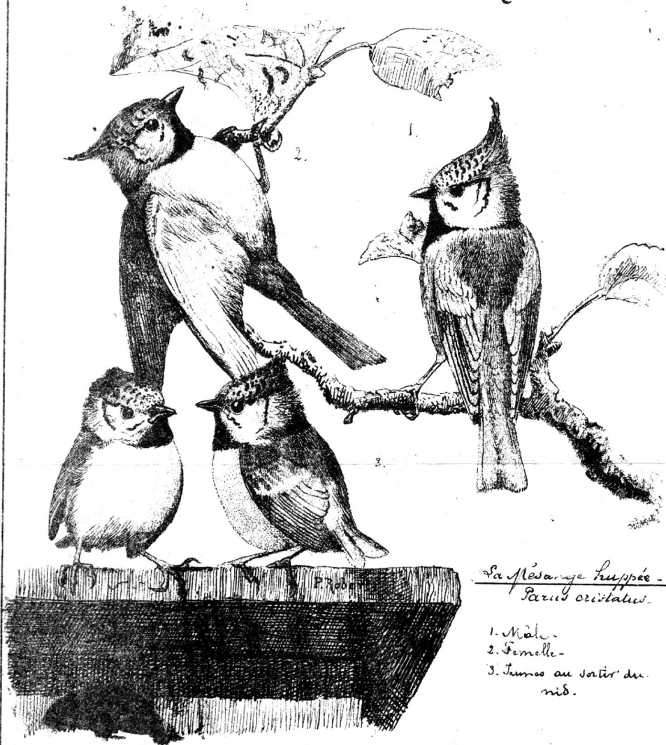
La Mésange huppée - Parus cristatus.