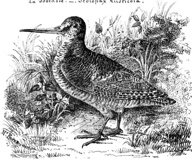
La Bécasse. — Scolopax rusticola.

un oiseau dans sa queue. Un coup de fusil retentit, le chat disparaît derrière un mur en lâchant sa proie.