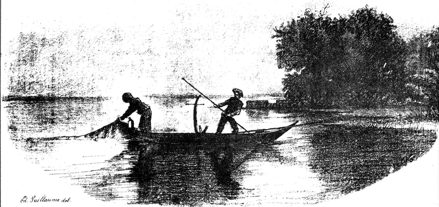
Ed. Guillaume del.

élégant dans ses formes, à dos gris brun et à ventre blanc; au toucher l'on remarque de chaque côté une ligne d'écaillés plus rudes et plus proéminentes que les autres et qui forment ce qu'on nomme "la ligne latérale".