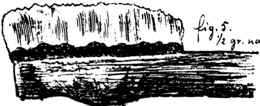
fig. 5. \frac{1}{2} gr. nat.

Les sociétés des Musées de l'Areuse et de Colombier continuent avec succès leurs fouilles dans la palafitte du Petit-Cortailhod.