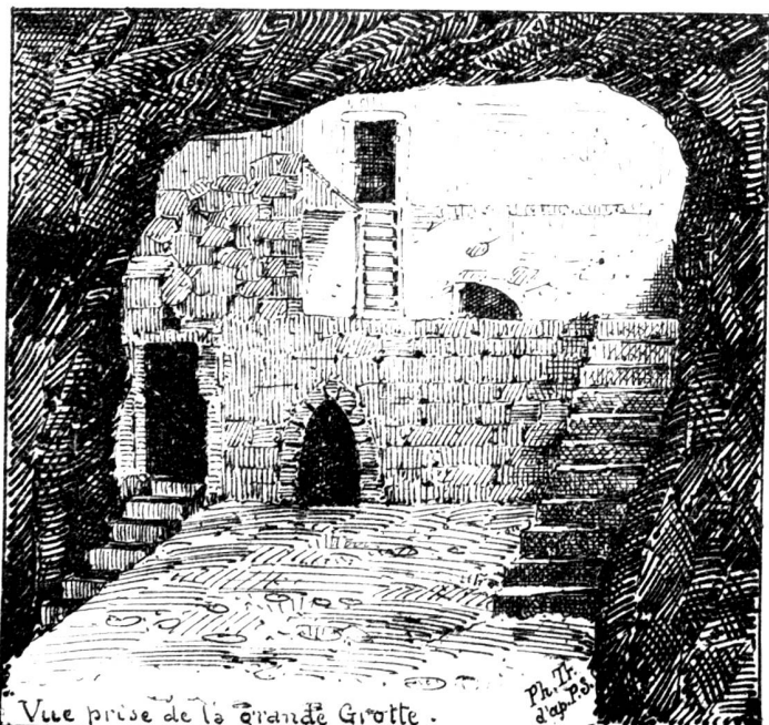
Vue prise de la Grande Grotte.