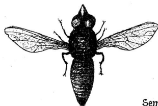
Insecte parfait (double grandeur naturelle).