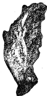
Feuille de Sempervivum tectorum L., après la sortie de la larve.

extrémité d'un rouge jaunâtre. Ses jambes et les tarses postérieurs sont d'un rouge jaunâtre, les premières portent une large bande brune, de sorte que le premier tiers de la jambe reste jaune. Ses tarses postérieurs sont bruns, de même que le dernier article des tarses antérieurs. A l'exception de quelques poils noirs, courts