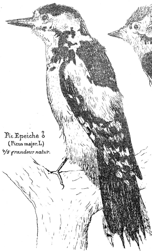
Pic Epeiche ♂ ( Picus major . L.) \frac{4}{5} grandeur natur.