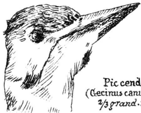
Pic cendré ( Cecinus canus , Gmel.) 2/3 grand. nat.

3. Le Pic cendré ( Cecinus canus , Gmelin). — Une espèce très voisine du Pic vert, mais beaucoup plus rare dans toute l'Europe, est le Pic cendré. Il est ainsi nommé à cause de la couleur fondamentale de ses joues et du dessus de sa tête. Lui aussi possède une aigrette rouge, mais beaucoup moins étendue et moins riche que celle du Pic vert. Le plumage de son corps est absolument semblable à celui de l'espèce précédente, seulement l'oiseau est un peu plus petit.