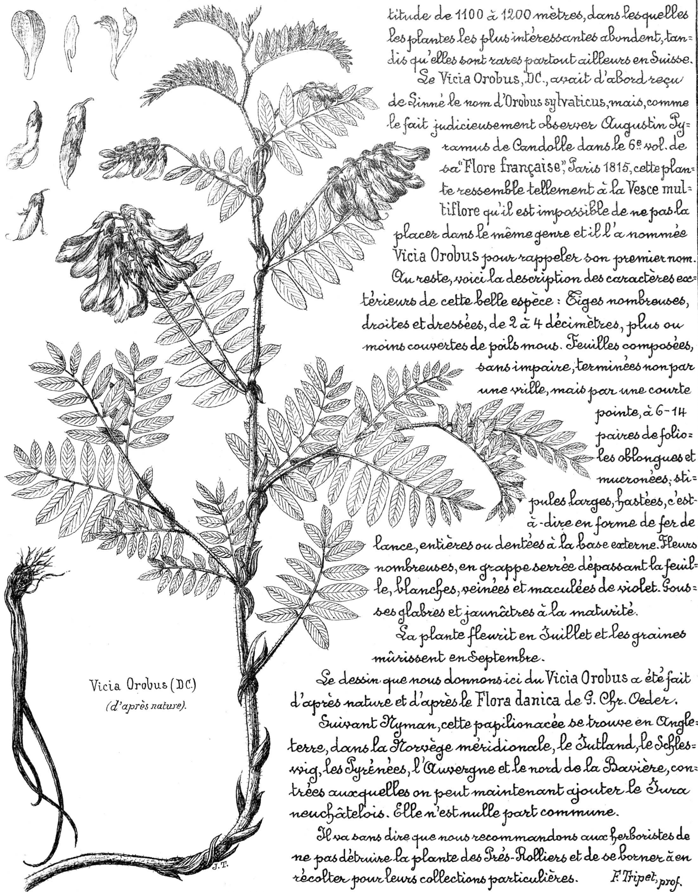
Vicia Orobus (DC.) (d'après nature).

titude de 1100 à 1200 mètres, dans lesquelles les plantes les plus intéressantes abondent, tandis qu'elles sont rares partout ailleurs en Suisse.