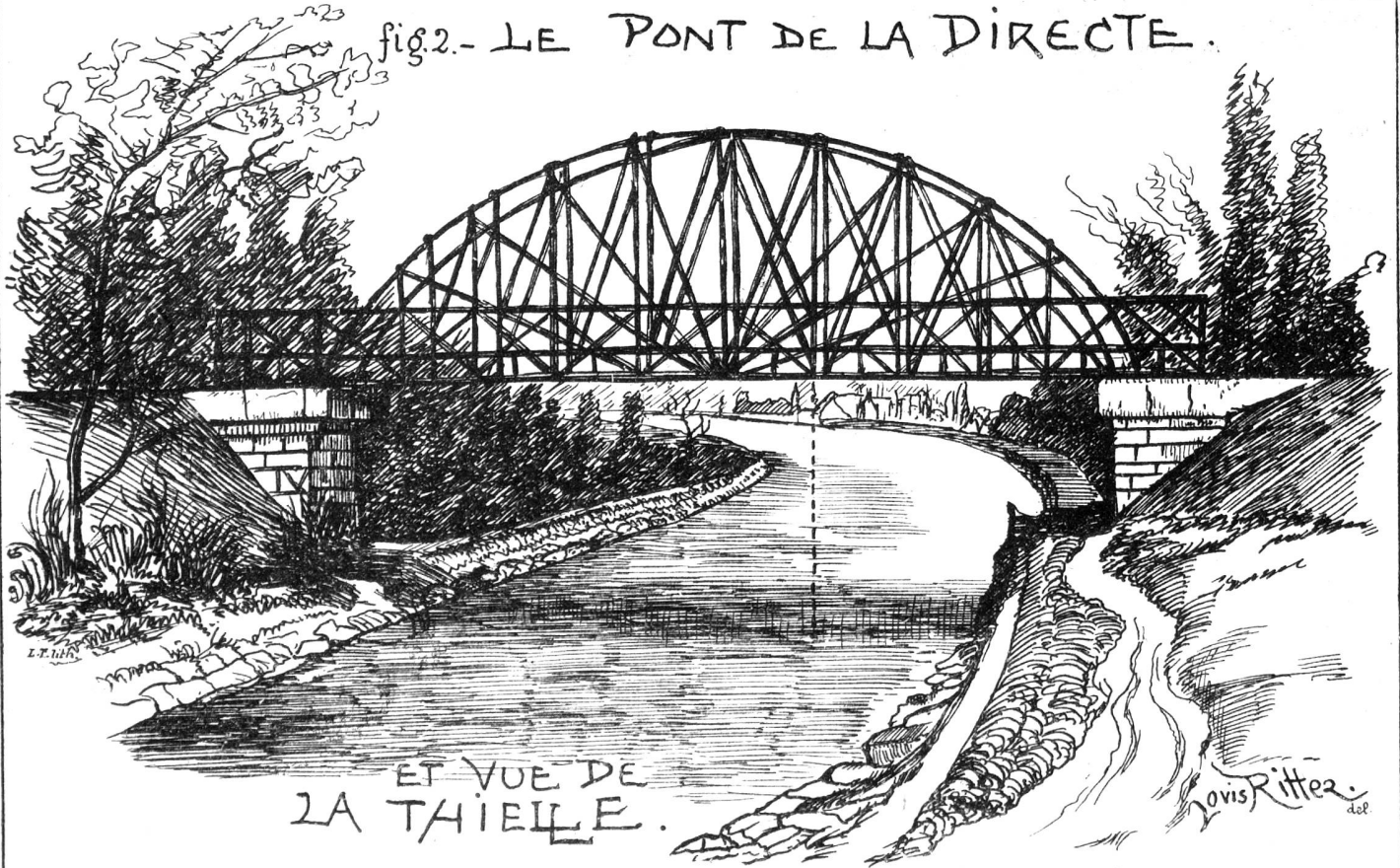
ET VUE DE LA THIELLE.