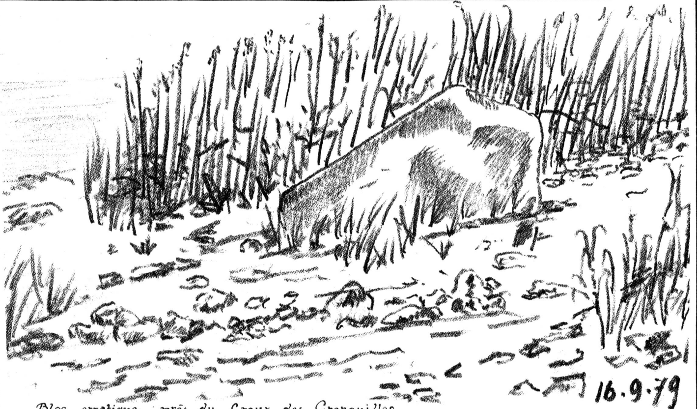
Bloc erratique, près du Creux des Grenouilles

Ci-après quelques renseignements concernant les travaux de cette première correction des eaux du Jura, obligeamment communiqués par M ons . l'ingénieur cantonal (Sept. 1930): Deux grands chantiers avaient été ouverts, l'un sous la direction des cantons supérieurs (Tand, Fribourg, Neuchâtel), l'autre sous la surveillance du gouvernement de Berne. Ses cantons supérieurs étaient chargés de l'exécution des canaux de la Broye et de la Thièle. Commencé en 1873, le plus gros du travail fut achevé en 1878; les travaux de parachèvement durèrent jusqu'en 1883. - Le canton de Berne exécuta les canaux de Hagneck, dès 1868, et de l'Arx en aval de Biennne de 1869 à 1882; ces deux derniers ouvrages ne furent réellement terminés qu'en 1891.