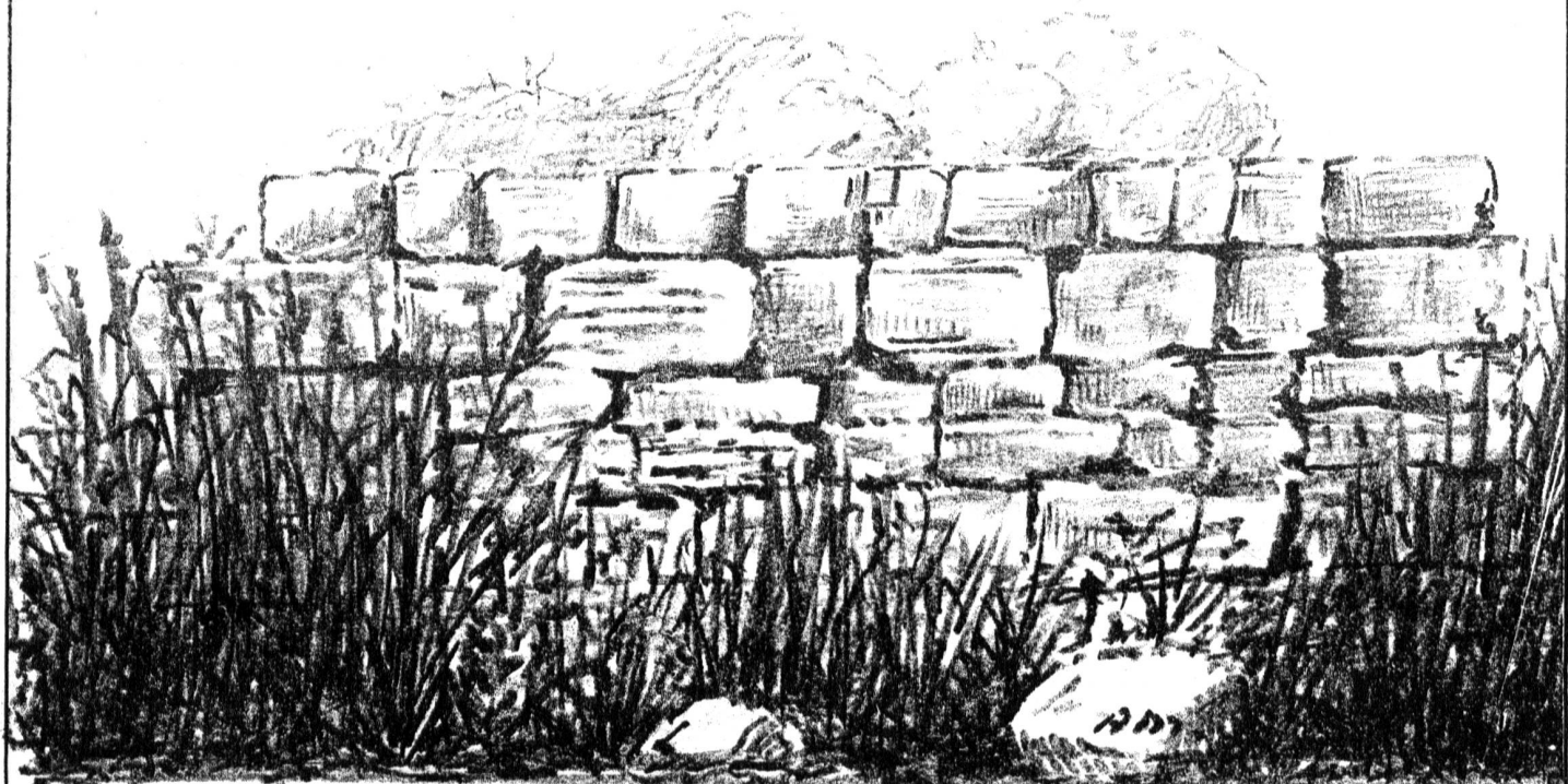
face ouest, môle du Creux des Grenouilles. 29. 1882

De l'autre côté du basquet feuillu, tout près du chemin, le coin des ruclous et un étang aux eaux croupissantes, dans lequel s'ébattaient de