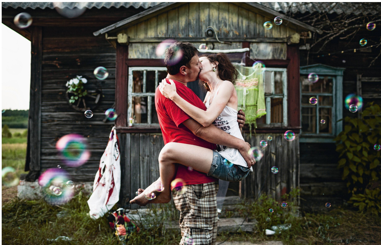
Für seine Bilderserie «Die Kinder von Tschernobyl» wurde Niels Ackermann zum Swiss-Press-Fotografen des Jahres 2016 gewählt.