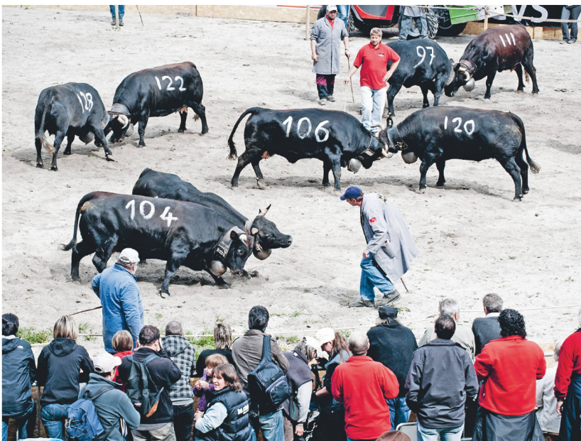
Bevor's auf die Alpweiden geht, machen die Eringer Kühe unter vielen neugierigen Blicken die Rangfolge unter sich aus.