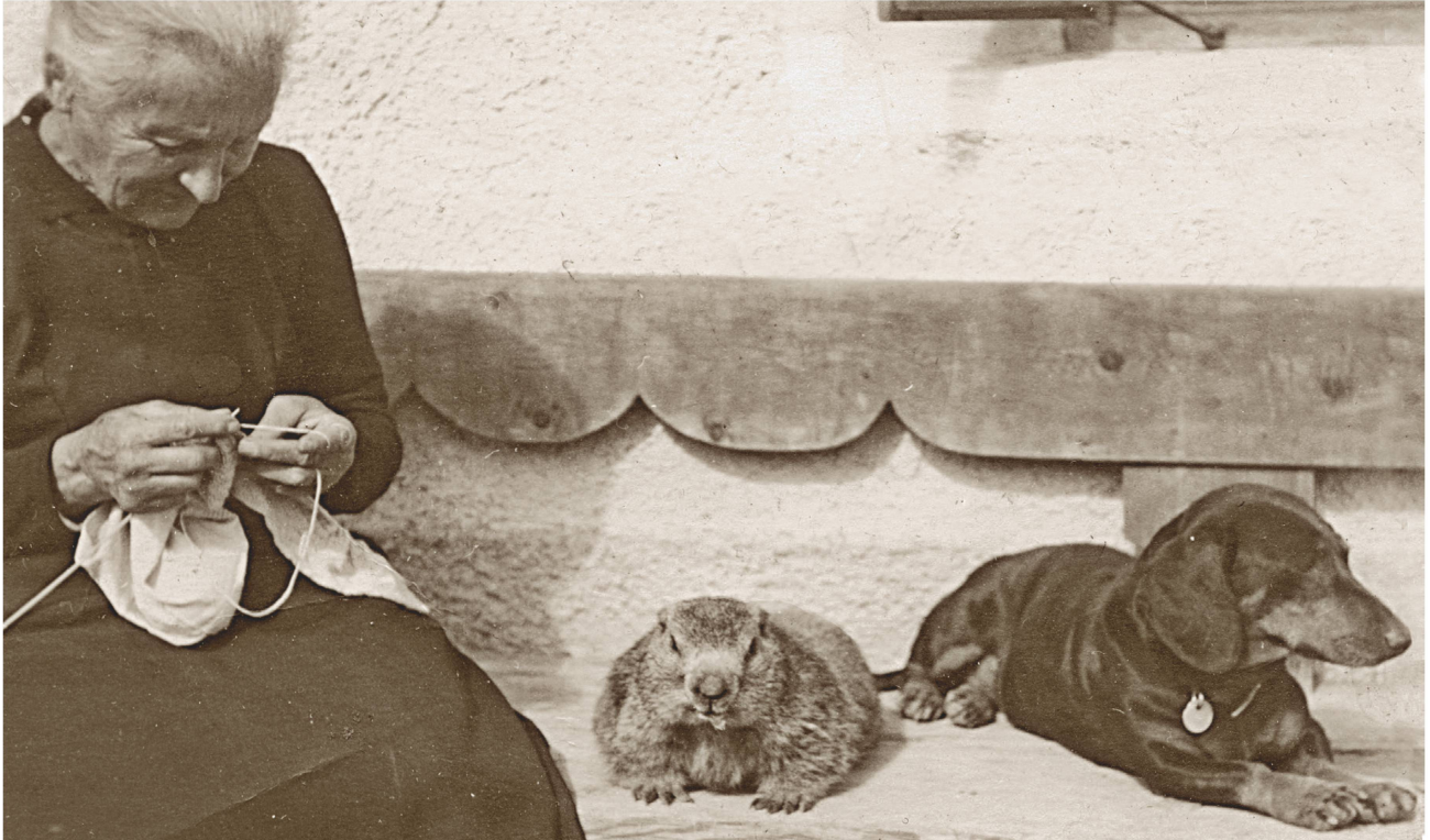
Murmeltiere wurden früher auch als Haustiere gehalten, wie dieses Bild von 1925 aus S-charl zeigt.

die Berglandschaft. «Das ist doch nichts, ein Sternzeichen haben wir schliesslich ebenfalls. Den Stier. Aber apropos Mut und Stärke, und apropos Fans: Wenn meine Eringer Cousins die Königin der Königinnen küren, dann kommen die Menschen von nah und fern.»