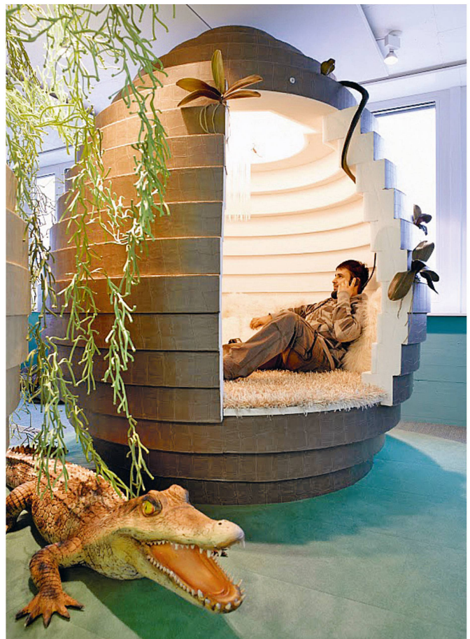
Ungewöhnliche Arbeitsplätze bei Google in Zürich.

Im Verlauf des 20. Jahrhunderts weichen Industrie und Arbeiterschaft schrittweise der Dienstleistungsgesellschaft und der damit aufkommenden allgegenwärtigen Bürowelt, die mittlerweile bereits wieder in Auflösung begriffen ist. Inte-