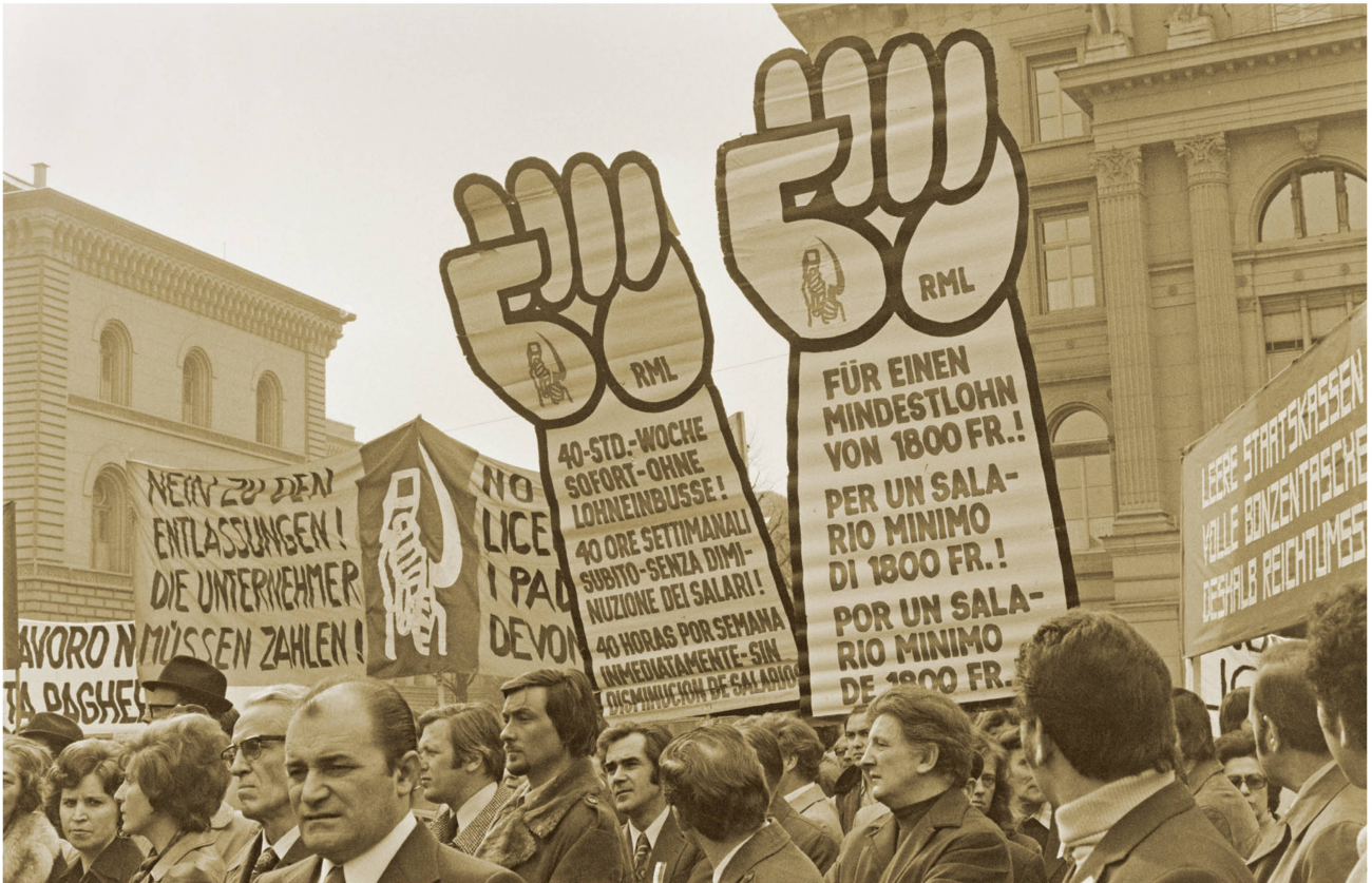
Demonstration von Schuhmachern auf dem Bundesplatz in Bern, um 1975.

ressant sind zahlreiche Fotografien, welche die weibliche Arbeitswelt im Wandel der Zeit und den in den 70er-Jahren erfolgten Zugang der Frauen zu den bisherigen «Männerberufen» dokumentieren, oder diejenigen, die von Zeiten der Vollbeschäftigung und von solchen der Arbeitslosigkeit, aber auch von einer zusehends unklarerer Grenze zwischen Arbeits- und Privatleben berichten.