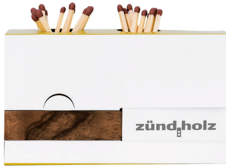
Streichholz-Spender: zündholz Schweizer Nussbaumholz, geölt 9,5 x 6,4 x 3,5 cm braun / CHF 31