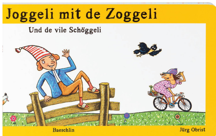
Buch: Vom Joggeli mit de Zoggeli Dan Wiener, Jürg Obrist, Baeschlin Verlag, 2018 / CHF 26.90