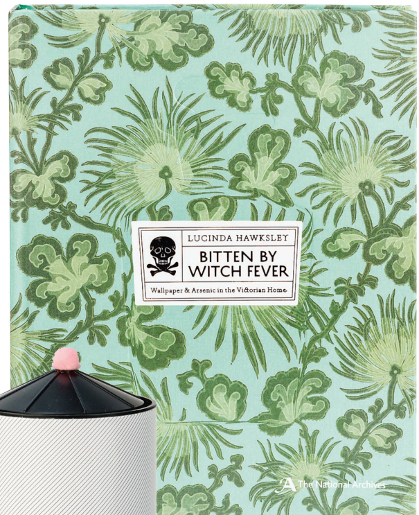
Buch: Bitten by Witch Fever Lucinda Hawksley, Thames & Hudson Ltd, 2016 / CHF 49.90