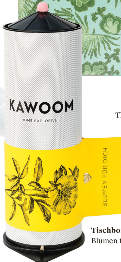
Tischbombe: KAWOOM Blumen für Dich / CHF 32