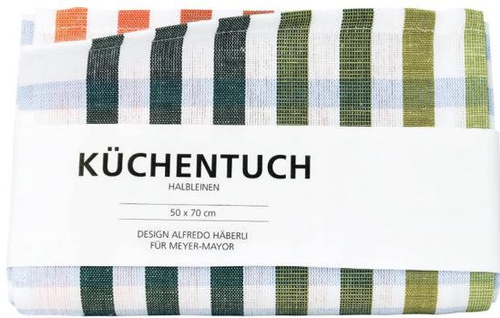
Küchentuch aus Halbleinen Alfredo Häberli für Meyer-Mayor / CHF 23.50