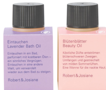
Eintauchen Lavender Bath Oil Eintauchen in ein Bad, parfümiert mit kostbaren Ölen – ein sinnliches Vergnügen. Eintauchen in eine andere Welt, um verwandelt wieder aus dem Bad zu steigen. Robert & Josiane