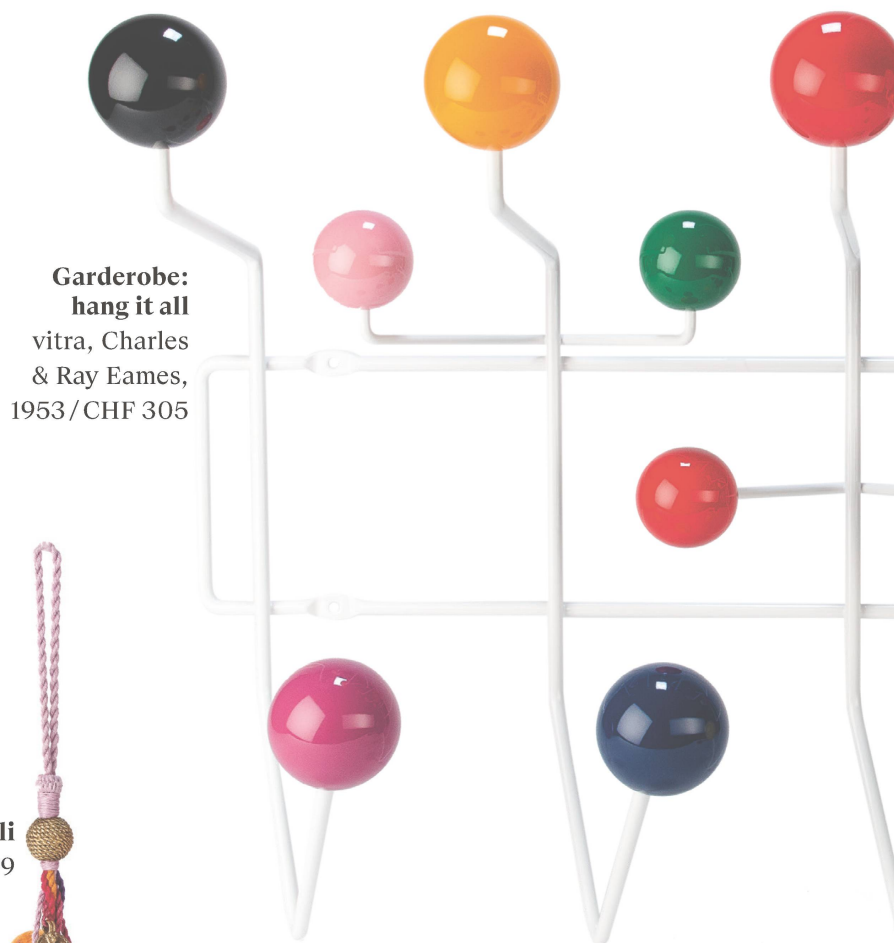
Garderobe: hang it all vitra, Charles & Ray Eames, 1953 / CHF 305