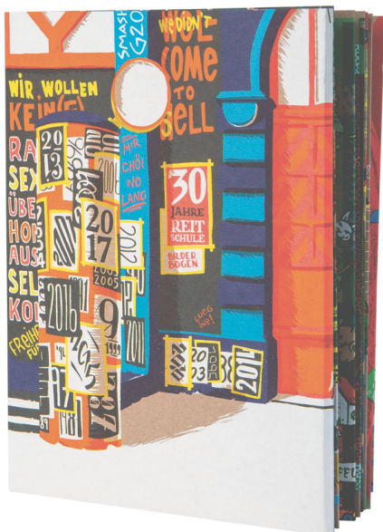
Publikation: 30 Jahre Reitschule Bern Abteilung Zukunft, kartonierter Einband, 64 Seiten / CHF 37.50