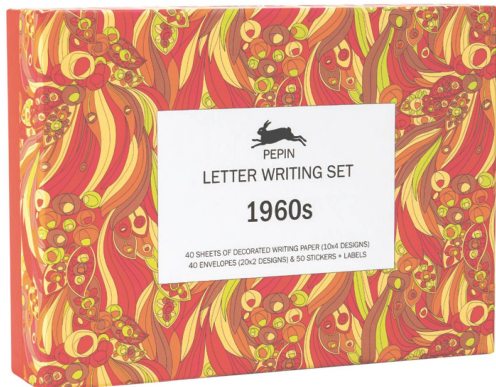
Letter Writing Set: 1960s Pepin / CHF 30.50