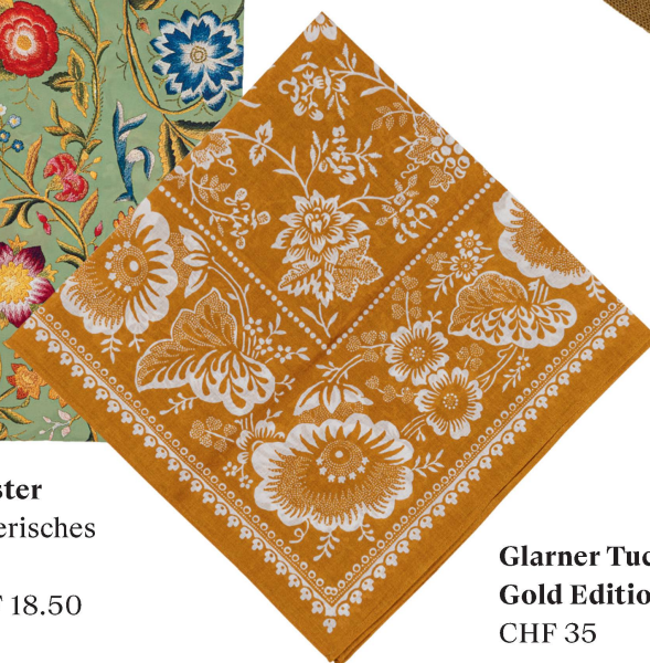
Glarner Tuch: Gold Edition CHF 35