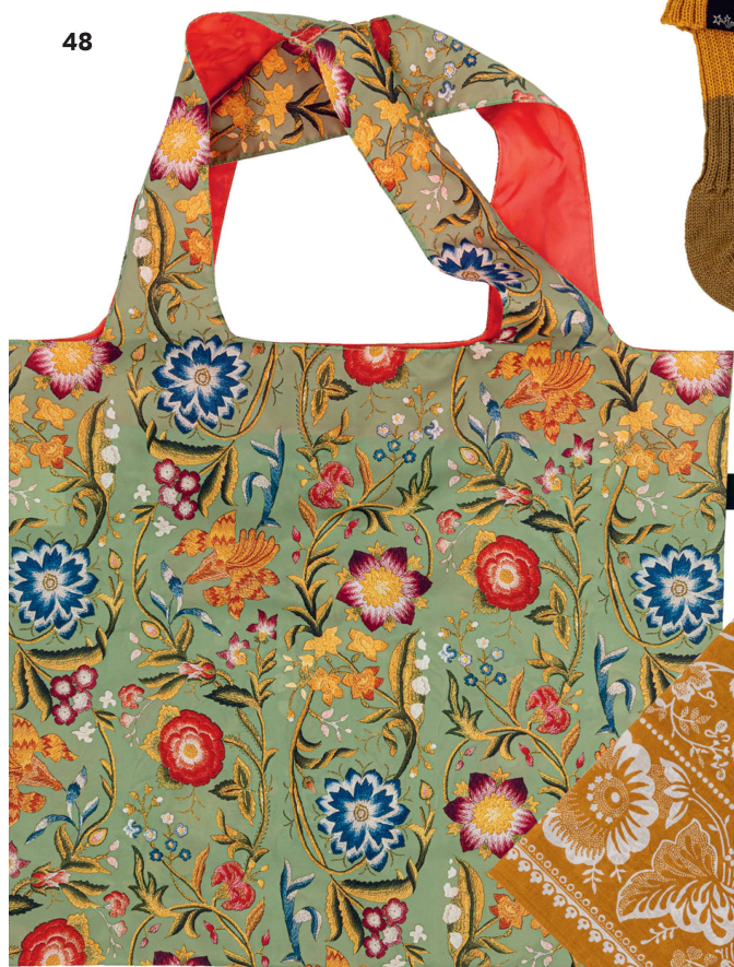
Tasche faltbar: Blumenmuster Aus der Sammlung Schweizerisches Nationalmuseum, Loqi «limited edition»/CHF 18.50