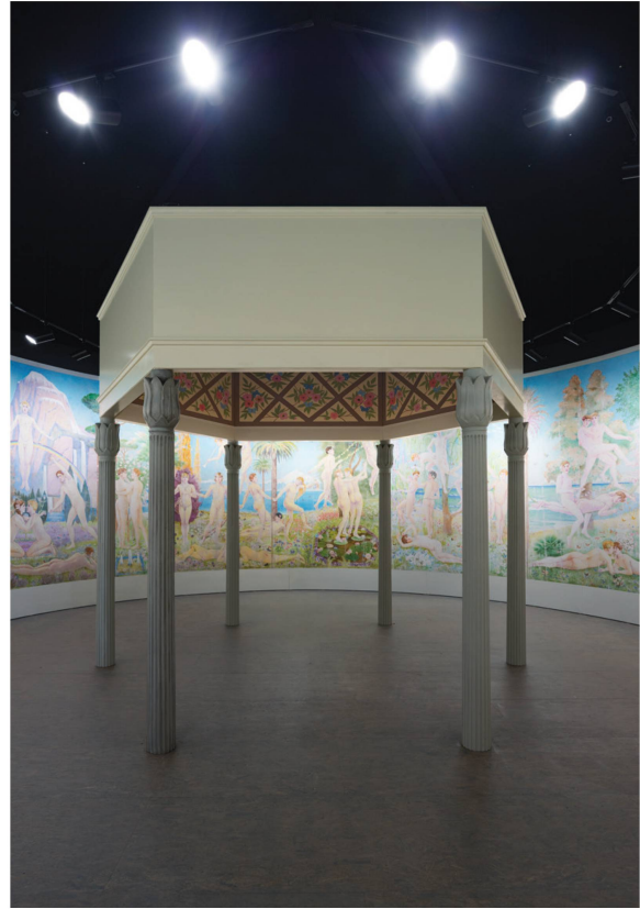
In der Casa Anatta (l.) und im Elisarion-Pavillon (r.) in die Geschichten und Ideale des Monte Verità eintauchen.