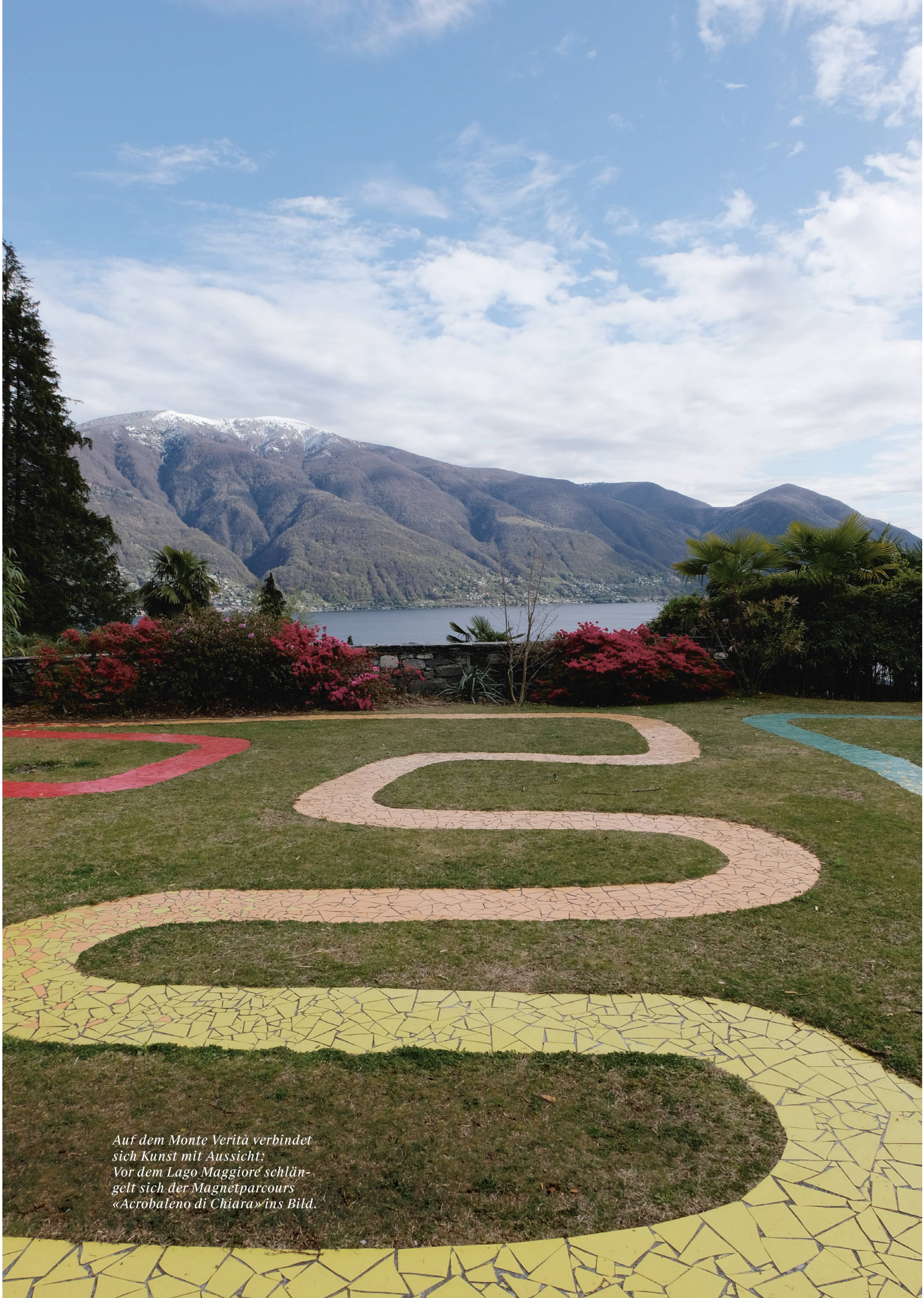
Auf dem Monte Verità verbindet sich Kunst mit Aussicht: Vor dem Lago Maggiore schlän- gelt sich der Magnetparcours «Acrobaleno di Chiara» ins Bild.