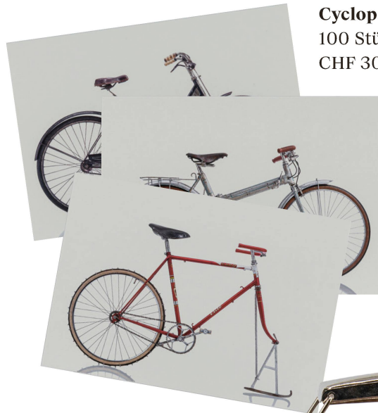
Postkarten: Cyclopedia 100 Stück/ CHF 30.50