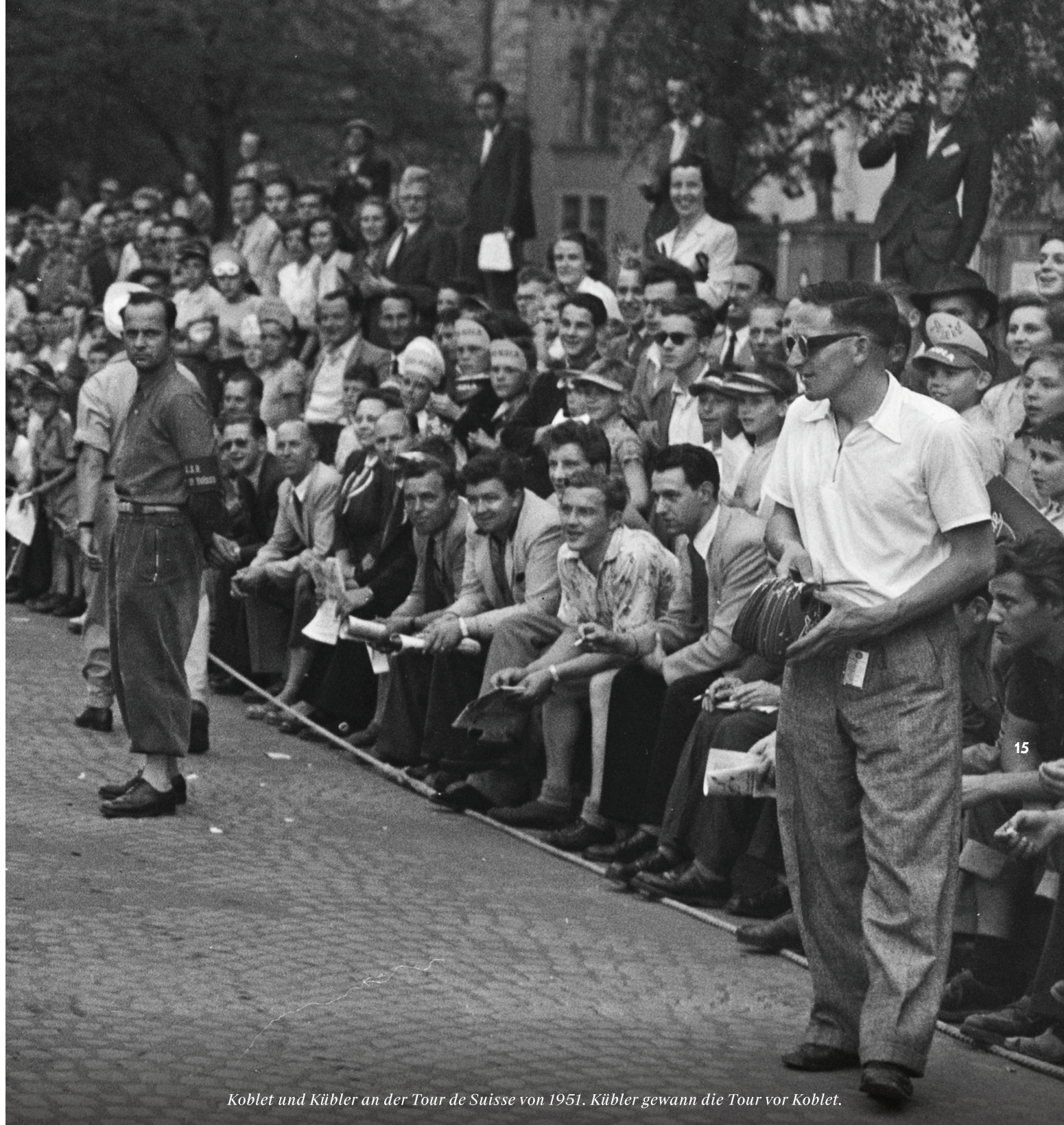
Koblet und Kübler an der Tour de Suisse von 1951. Kübler gewann die Tour vor Koblet.

Ein Rahmen, ein Lenker, zwei Räder und fertig ist das Sportgerät. So einfach das Velo gebaut ist, so vielfältig sind seine Anwendungen. Ob auf der Strasse, in der Halle oder querfeldein durch den Schlamm: mit der Erfindung des modernen Fahrrads Mitte des 19. Jahrhunderts wurde auch der Radsport geboren. Seine rund 150-jährige Geschichte ist voller schillernder Figuren, über-