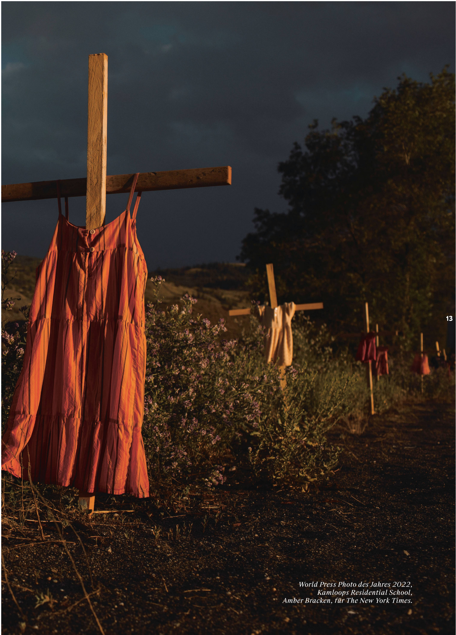
World Press Photo des Jahres 2022, Kamloops Residential School, Amber Bracken, für The New York Times.