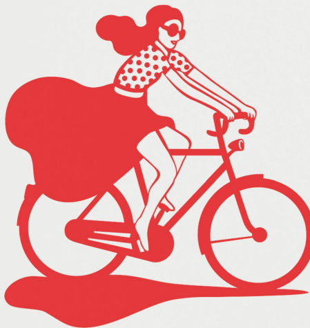
Notizheft: La belle échappée A5, bernard & eddy / CHF 12