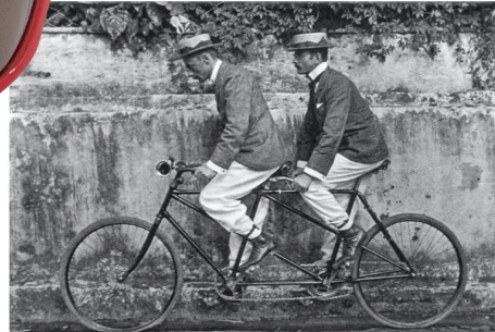
Magnet: Männer auf Tandem Diverse Sujets / CHF 6.90