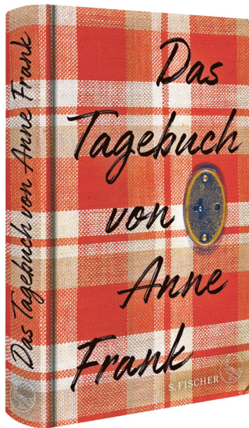
Buch: Das Tagebuch von Anne Frank Gebundene Ausgabe, 384 Seiten, S. Fischer Verlag/CHF 35.90

Schöne Sachen findet man im Landesmuseum Zürich nicht nur in den Ausstellungen, sondern auch in der Boutique – und vielleicht bald schon bei sich zuhause.