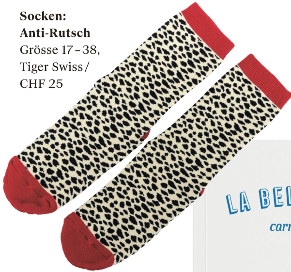
Socken: Anti-Rutsch Grösse 17-38, Tiger Swiss / CHF 25