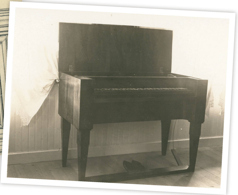
Manche Objekte haben es nicht in die Sammlung geschafft - dennoch sind Spuren von ihnen erhalten geblieben.