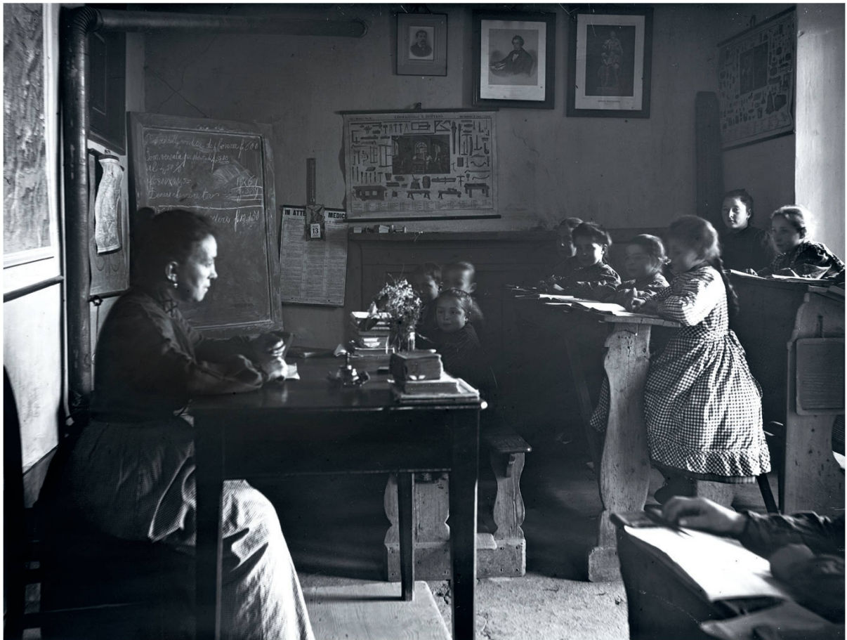
Tessiner Dorfschule um 1920. Diapositiv: Gelatine-Trockenplatte auf Glas.

In der Südschweiz nahm die Beziehung zum Dialekt in den letzten 400 Jahren einen Zwischenweg. Zuhause dominierte der Dialekt, in Büchern und Kirche war es die von Florenz ausgehende Sprache von Literaten und Beamten. Mit dem zunehmenden Kontakt zwischen den Regionen verbreitete sich dieses Italienisch im 19. Jahrhundert aber so weit, dass der Dialekt auch aus der Schule verdrängt oder gar verboten wurde. Im Unterschied zum Patois pflegten einige Südschweizer Familien die Dialekte aber weiter in den eigenen vier Wänden. Im 20. Jahrhundert entdeckte man den Dialekt als Sprache der kulturellen Verwurzelung wieder; heute ist er für rund einen Drittel der Bevölkerung die bevorzugte Sprache im privaten Bereich. ●