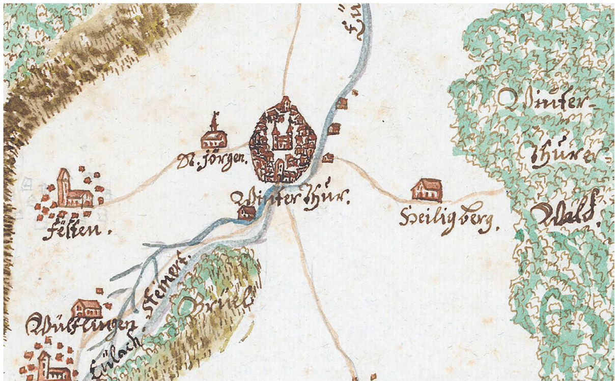
Karte Winterthur und Umgebung, ca. 1709.

schen Sprache an. So entstanden im Verlauf der Jahrhunderte die heute bekannten Deutschschweizer Ortsnamen. In den romanischsprachigen Landesteilen blieb dieser Sprachwechsel aus – stattdessen entwickelten sich die dortigen Ortsnamen in den jeweiligen romanischen Dialekten und Sprachen weiter.