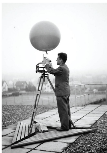
Durant les années 1930 et 1940, les vents d'altitude étaient mesurés à l'aide d'un ballon comme celui-ci.

En dépit des techniques les plus modernes, de la connectivité globale et de la capacité à suivre l'évolution du temps depuis l'espace, nombreuses sont les personnes qui se fient encore aux vieux dictons paysans. Ces adages populaires en vers sont transmis de générations en générations et surprennent par leur précision. Une grande partie de ces dictons ont été rédigés à une époque où on ne connaissait pas encore précisément les processus à l'origine de la pluie ou de l'orage. Ces phénomènes sont aujourd'hui bien connus et sont expliqués dans l'exposition. Différentes stations permettent également aux visiteurs de vivre de près le temps. Installé sur une grande banquette, il est ainsi possible de s'exposer à plusieurs changements météorologiques soudains. Un simulateur permet de créer sa propre tempête virtuelle. ☁