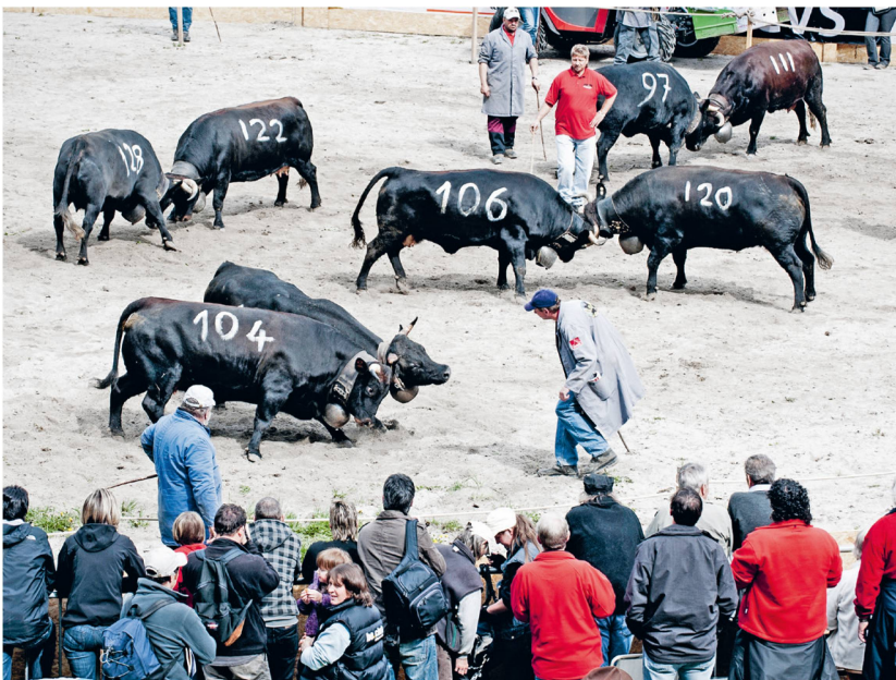
Avant l'inalpe, les vaches d'Hérens s'affrontent sous le regard de nombreux curieux pour déterminer la hiérarchie du troupeau.