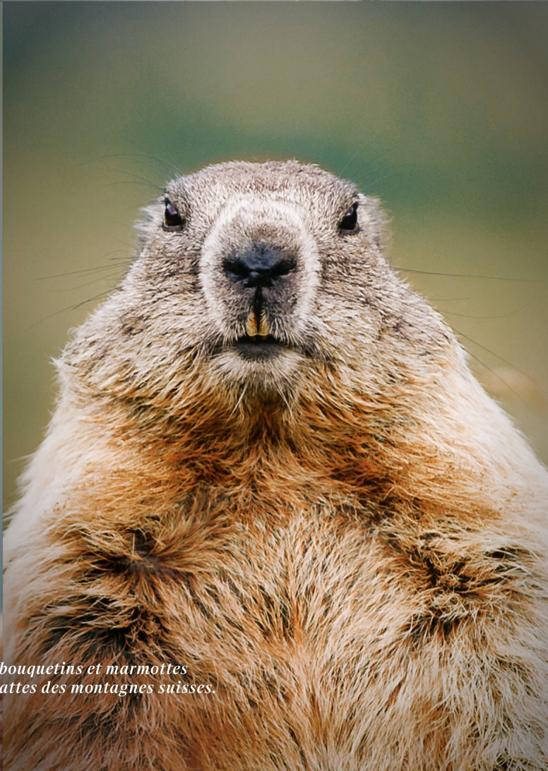
Vaches, saint-bernard, bouquetins et marmottes sont les vedettes à quatre pattes des montagnes suisses.