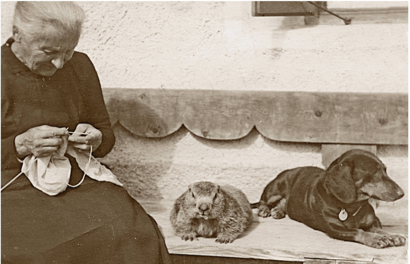
Les marmottes faisaient autrefois partie des animaux domestiques comme le montre cette photo de 1925 prise à S-charl.

mes cousines d'Hérens en connaissent un rayon, et lorsqu'elles choisissent leur reine, les hommes accourent de loin pour assister au sacre.»