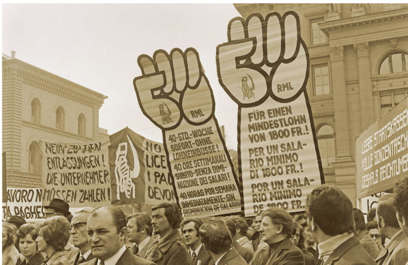
Démonstration de cordonniers sur la Place fédérale, à Berne, vers 1975.

sa récente dématérialisation. Les clichés témoignent aussi des professions exercées par les femmes au fil du temps, avec leur accession dans les années 70 à des métiers réservés jusqu'alors aux hommes, des tensions entre plein emploi et chômage et de la dissolution