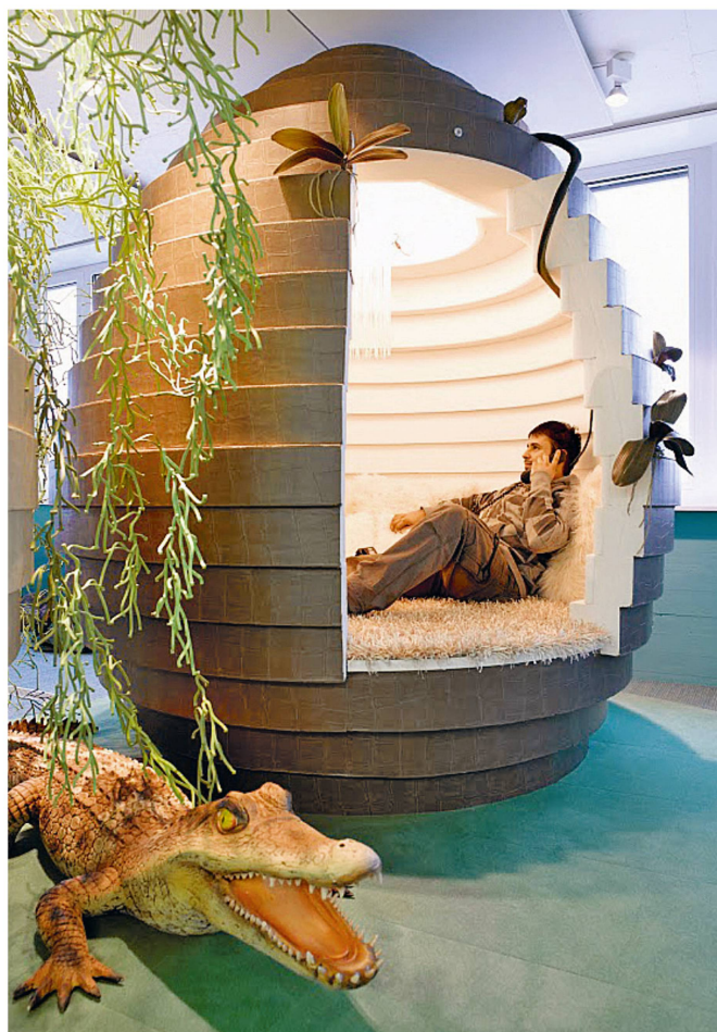
Des postes de travail inhabituels chez Google, à Zurich.

Au cours du 20 e siècle, la progressive disparition de la production industrielle et de la main d'œuvre ouvrière est mise en évidence au profit des activités dites de services, de la prépondérance d'une population d'employés et de l'omniprésence de l'univers du bureau jusqu'à