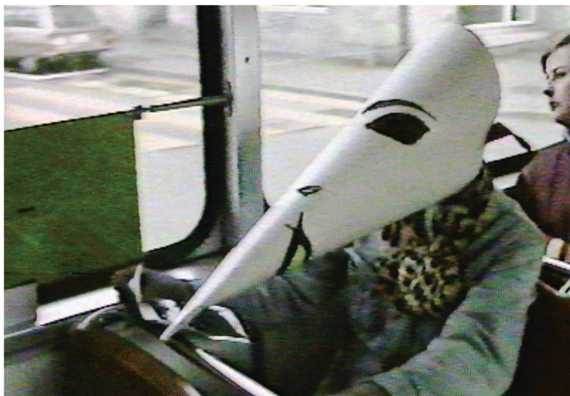
Capture d'écran tirée du documentaire sur l'histoire et l'évacuation de l'immeuble occupé situé Badenerstrasse 2 à Zurich: 1 Lovesong.