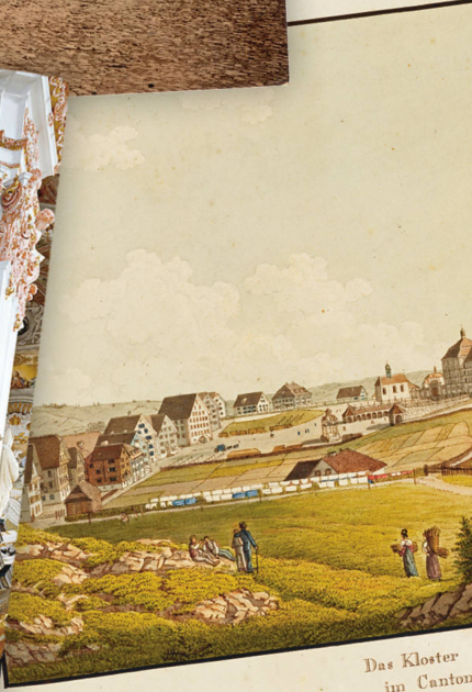
Das Kloster F im Canton

Les nombreux visiteurs ne font pas qu'apporter de riches présents, ils repartent aussi avec des souvenirs qui vont des classiques cartes postales aux cierges bénits.