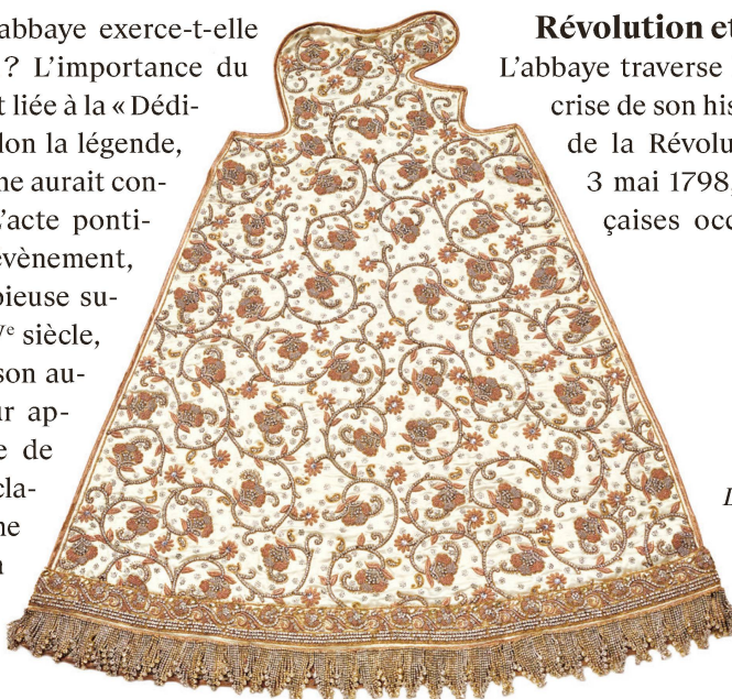
La plupart des tenues de la Vierge noire sont des cadeaux. La tenue Utara a été offerte par un hindou indien venant de Mumbai.

L'abbaye traverse la plus importante crise de son histoire au lendemain de la Révolution française. Le 3 mai 1798, des troupes françaises occupent Einsiedeln.