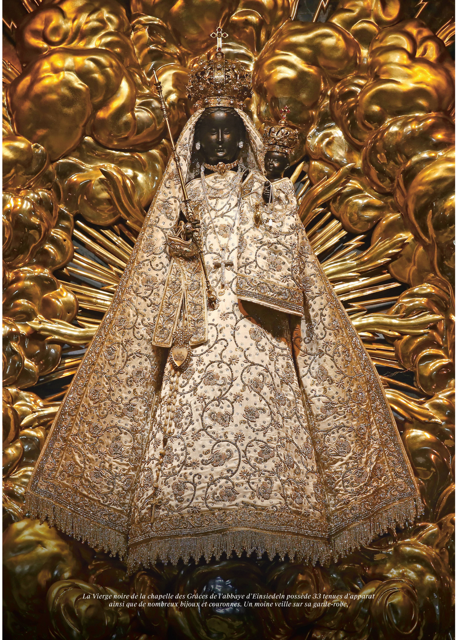
La Vierge noire de la chapelle des Grâces de l'abbaye d'Einsiedeln possède 33 tenues d'apparat ainsi que de nombreux bijoux et couronnes. Un moine veille sur sa garde-robe.