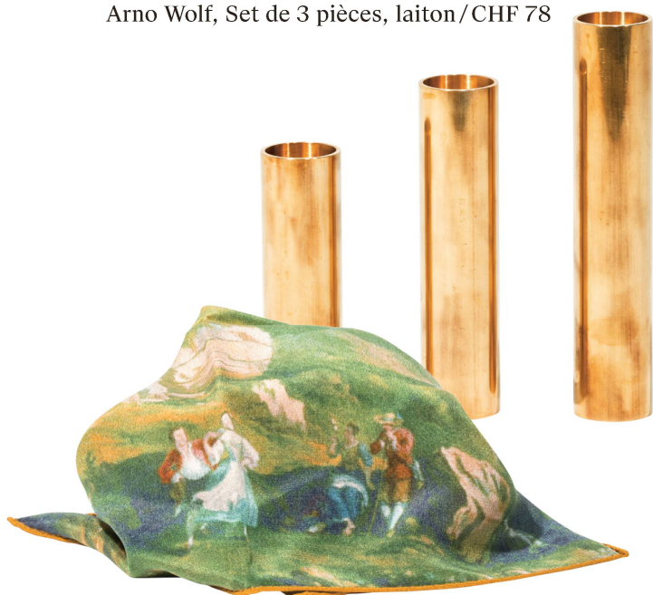
Carré : Edition Musée national suisse Caroline Flueler, soie, dim. : env. 30×30 cm/CHF 45