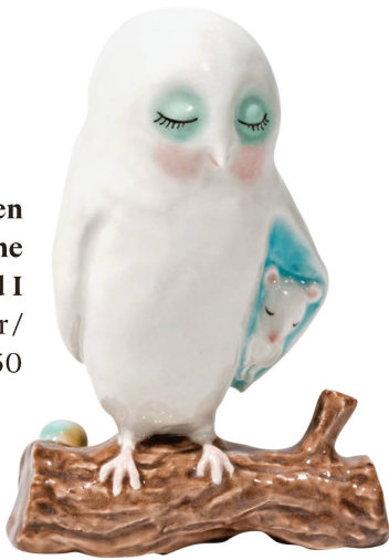
Statue en porcelaine hibou : You and I Babette Mäder / CHF 650