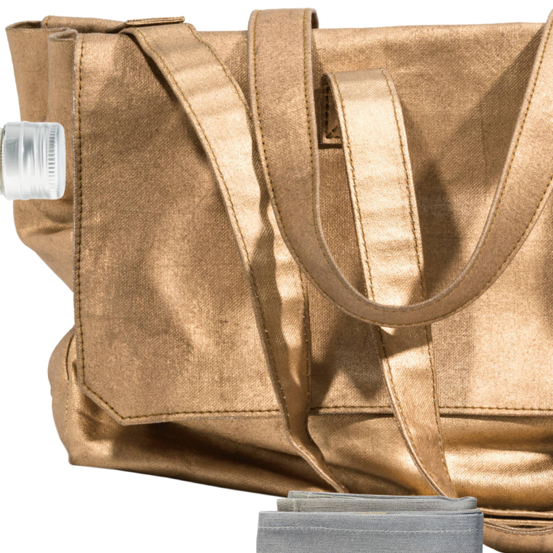
Sac en toile by Wanda Bracher : Petit cabas Nesrin Toile, fabriqué à la main en Suisse/CHF 880