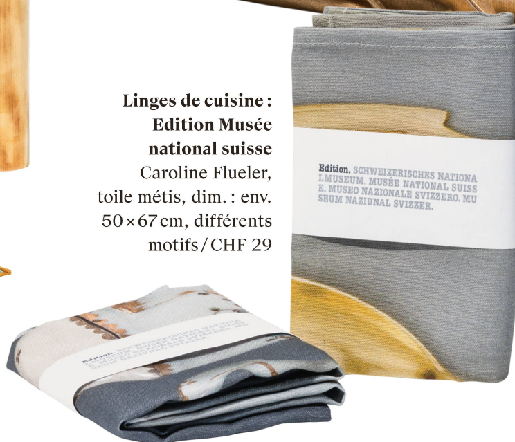
Linges de cuisine : Edition Musée national suisse Caroline Flueler, toile métis, dim. : env. 50×67 cm, différents motifs/CHF 29