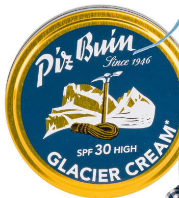
Crème : crème des glaciers Piz Buin, 40 ml / CHF 12