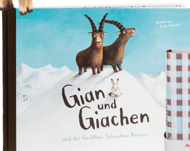
Livre : Gian und Giachen J. v. Matt, Amélie Jackowski, éditions NordSüd 2016 / CHF 25