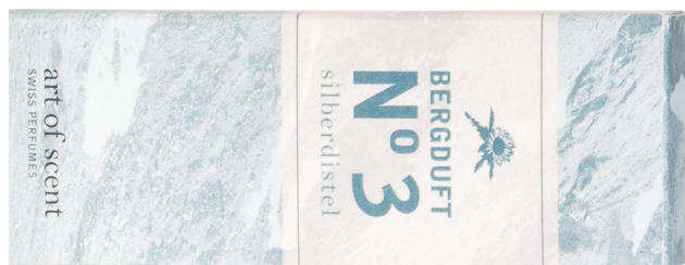
Parfum : Bergduft N°3 Silberdistel art of scent, 50 ml / CHF 79