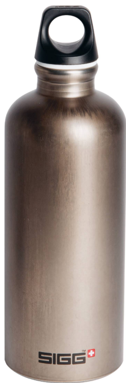
Gourde: Traveller Smoked Pearl Sigg, 0,6l/CHF 24.90