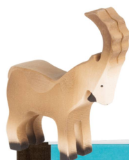
Figurine en bois : Bouquetin Trauffer / CHF 19.50