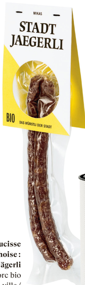
Saucisse zurichoise : Stadtjägerli Mikas, porc bio de la ville / CHF 5.90