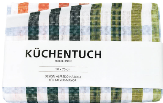
Linge de cuisine en toile métis Alfredo Häberli pour Meyer-Mayor / CHF 23.50