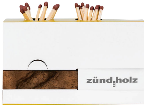
Distributeur d'allumettes : zündholz En bois de noyer suisse, verni 9,5 x 6,4 x 3,5 cm brun / CHF 31