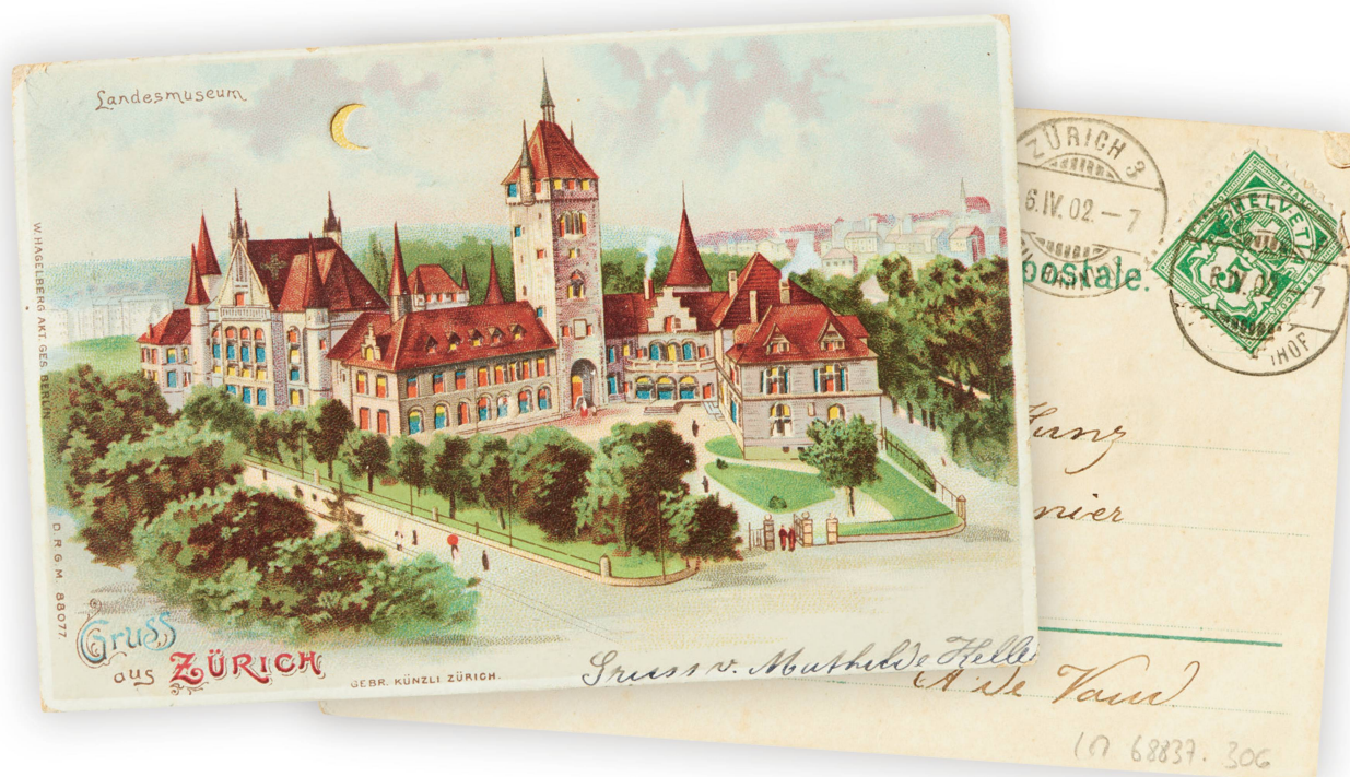
Le Musée national à Zurich était un motif très volontiers représenté sur les cartes postales du début du XX e siècle.

A u début du XX e siècle, les cartes postales jouissaient d'une énorme popularité. En Suisse, il s'en envoyait chaque année des millions, dont certaines arboraient le Musée national, l'un des curiosités emblématiques de la ville de Zurich.