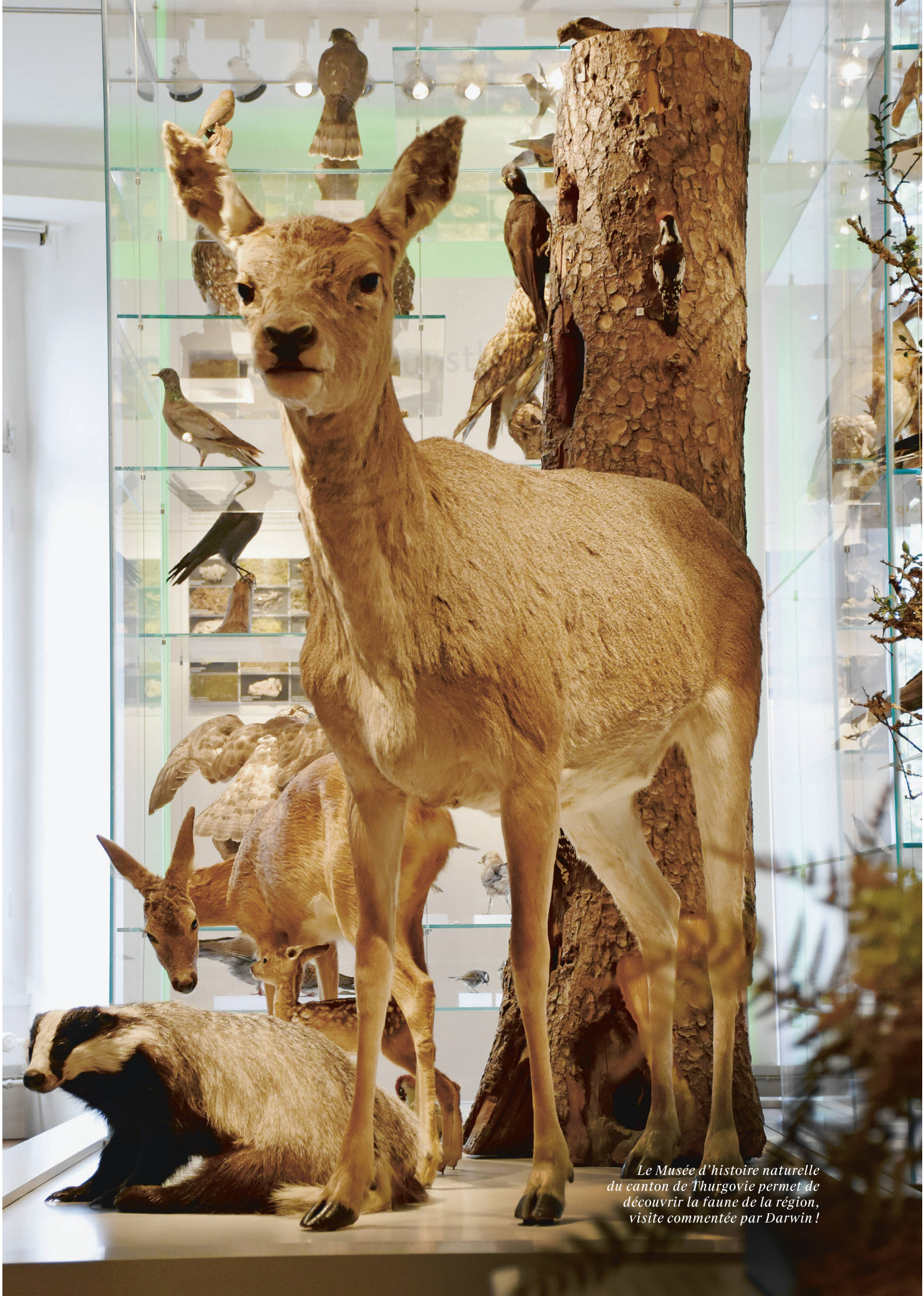
Le Musée d'histoire naturelle du canton de Thurgovie permet de découvrir la faune de la région, visite commentée par Darwin!