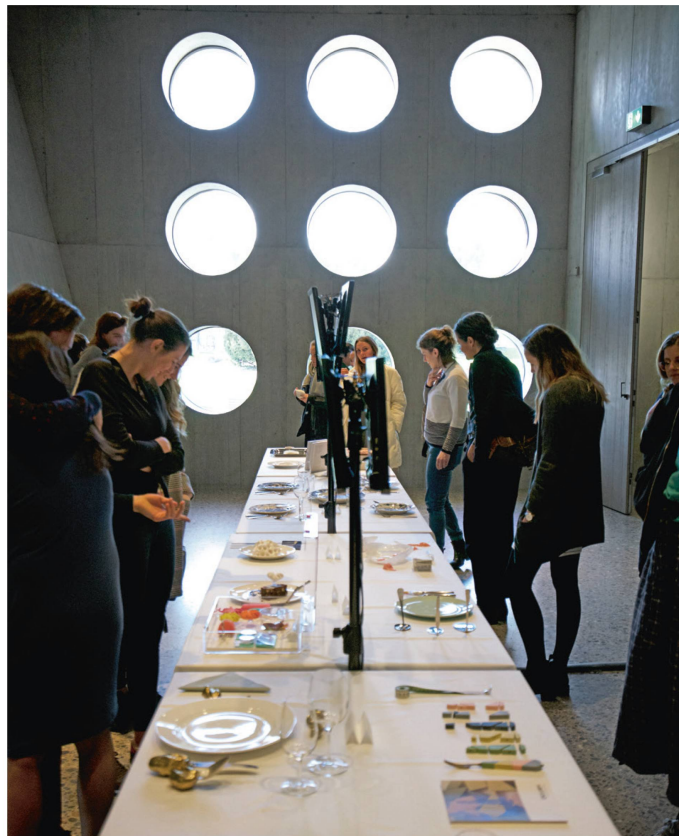
Lors d'une journée spéciale organisée dans le cadre de l'exposition « À la recherche du style. 1850 à 1900 », de jeunes designers se sont interrogés sur des questions liées aux styles et tendances et à leurs sources d'inspiration.