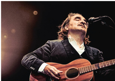
Au début de l'été, Stephan Eicher a enchanté le public réuni dans la cour intérieure du Musée national.

Le diplomate et homme politique Tim Guldemann est le nouveau Président du conseil du Musée national suisse.