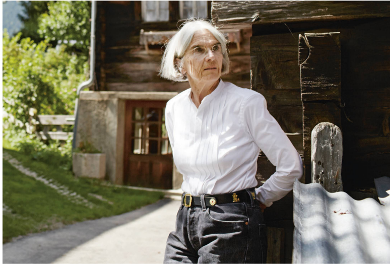
L'auteure à succès Donna Leon vit et écrit aujourd'hui en Suisse.