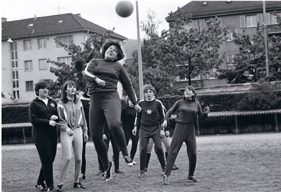
Photo issue d'un reportage sur le « Damen-Fussball-Club Zürich », mars 1968.