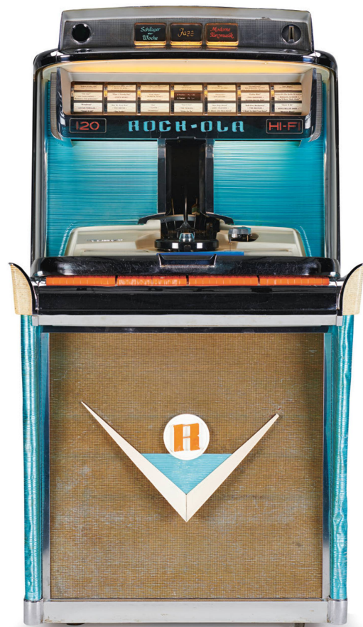
Jukebox Rock-Ola, Chicago USA, 1959.

À Lausanne, la jeunesse se rend le dimanche soir au club « Saint-François-des-Prés », installé dans la cave d'un hôtel. On y déclame des poèmes, on joue du jazz et on danse. Mais il ne s'agit pas des danses classiques que l'on célèbre dans la bonne société. On danse le swing et le jitterbug sur les rythmes effrénés d'outre-Atlantique. Les deux sexes se côtoient dans une ambiance décontractée. C'est presque en dansant qu'ils se libèrent des conceptions morales qui sont alors en vigueur. En 1950, un journaliste de l'agence Presse Diffusion Lausanne se rend au club et oublie vite son scepti-