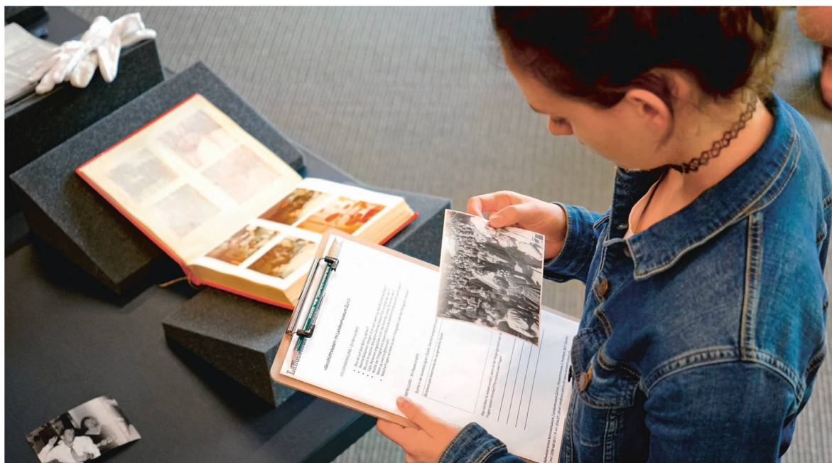
Au Musée national, le Laboratoire d'histoire fait le lien entre le passé et le quotidien des élèves.

C omment amener les élèves à développer un rapport émotionnel avec l'histoire? Le Laboratoire d'histoire du Musée national Zurich y est parvenu en jetant des ponts entre leur quotidien scolaire, leur histoire personnelle et les faits historiques. L'atelier très prisé du public est proposé par l'établissement depuis 2017.