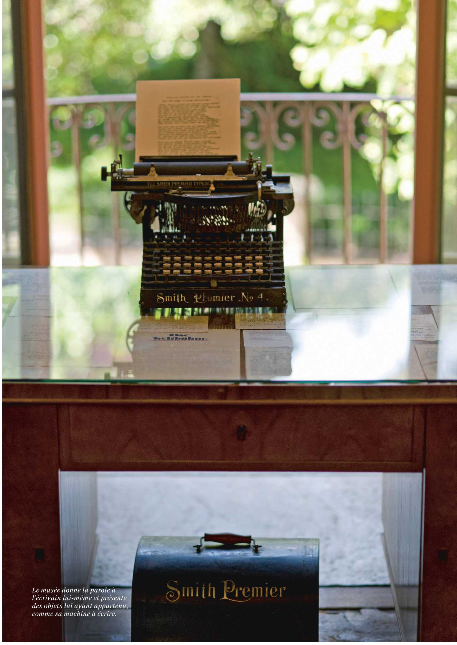
Le musée donne la parole à l'écrivain lui-même et présente des objets lui ayant appartenu, comme sa machine à écrire.