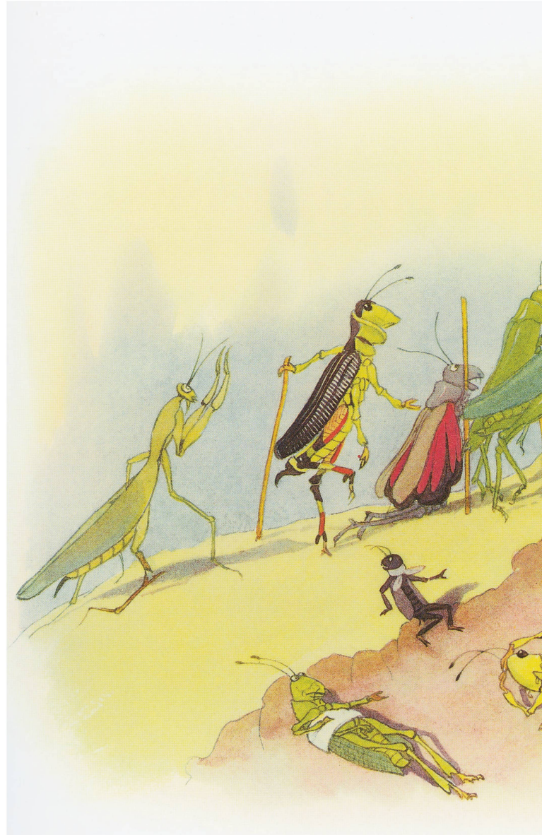
« Alpenblumenmärchen », d'Ernst Kreidolf, dans lequel la fleur Arnica soigne des insectes blessés, fait allusion à la Première Guerre mondiale.

Il n'est donc pas étonnant que les livres créés par Kreidolf et mettant en scène des fleurs, des animaux et des nains, puissent être considérés, avec « Joggeli » de Lisa Wenger, comme les ouvrages fondateurs du livre illustré suisse et soient restés populaires pendant des générations. Mais si vous y regardez de plus près, vous découvrirez plus qu'un simple romantisme épris de nature. Cela est dû à la précision botanique de Kreidolf mais également aux allusions au contexte historique: malgré toute la gentillesse des fleurs humanisées, « Alpenblumenmärchen » (1922) fait référence à la Première Guerre mondiale. Tels des généraux cuirassés et armés, Aconit, Pied d'alouette et Vétrate se tiennent debout, sur la colline devant laquelle défilent des sauterelles tandis que des insectes bourdonnent dans l'air comme des escadrons de biplans. Le fait que Kreidolf met en scène des généraux sous la forme de plantes toxiques est une