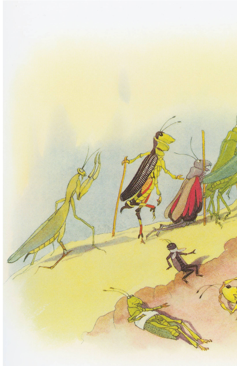
« Alpenblumenmärchen », d'Ernst Kreidolf, dans lequel la fleur Arnica soigne des insectes blessés, fait allusion à la Première Guerre mondiale.

Il n'est donc pas étonnant que les livres créés par Kreidolf et mettant en scène des fleurs, des animaux et des nains, puissent être considérés, avec « Joggeli » de Lisa Wenger, comme les ouvrages fondateurs du livre illustré suisse et soient restés populaires pendant des générations. Mais si vous y regardez de plus près, vous découvrirez plus qu'un simple romantisme épris de nature. Cela est dû à la précision botanique de Kreidolf mais également aux allusions au contexte historique: malgré toute la gentillesse des fleurs humanisées, « Alpenblumenmärchen » (1922) fait référence à la Première Guerre mondiale. Tels des généraux cuirassés et armés, Aconit, Pied d'alouette et Vératre se tiennent debout, sur la colline devant laquelle défilent des sauterelles tandis que des insectes bourdonnent dans l'air comme des escadrons de biplans. Le fait que Kreidolf met en scène des généraux sous la forme de plantes toxiques est une