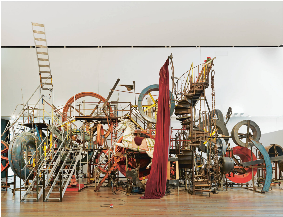
Créé par Mario Botta, le bâtiment abrite entre autres la Grosse Méta-Maxi-Maxi-Utopia de Tinguely.