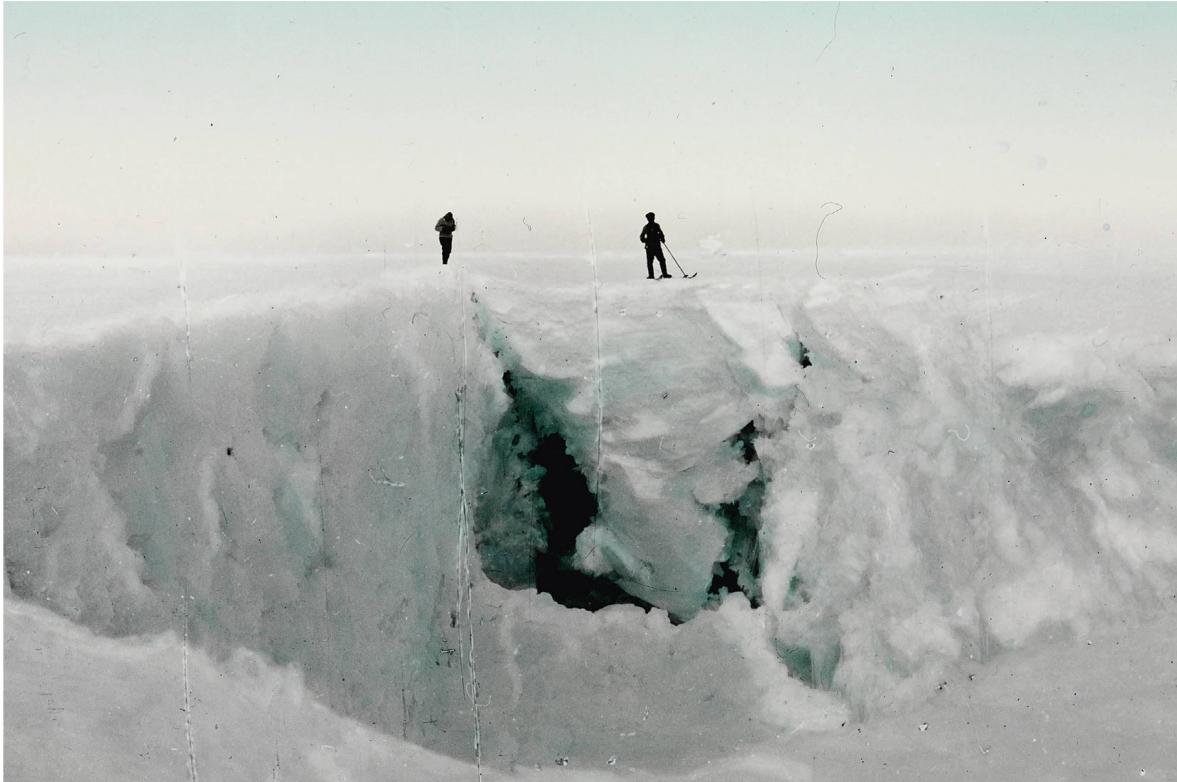
Cette expédition n'était pas sans danger, la glace dissimulant par endroit des crevasses.

en profita grandement. Ce reportage déclencha une véritable « fièvre polaire » en Suisse.