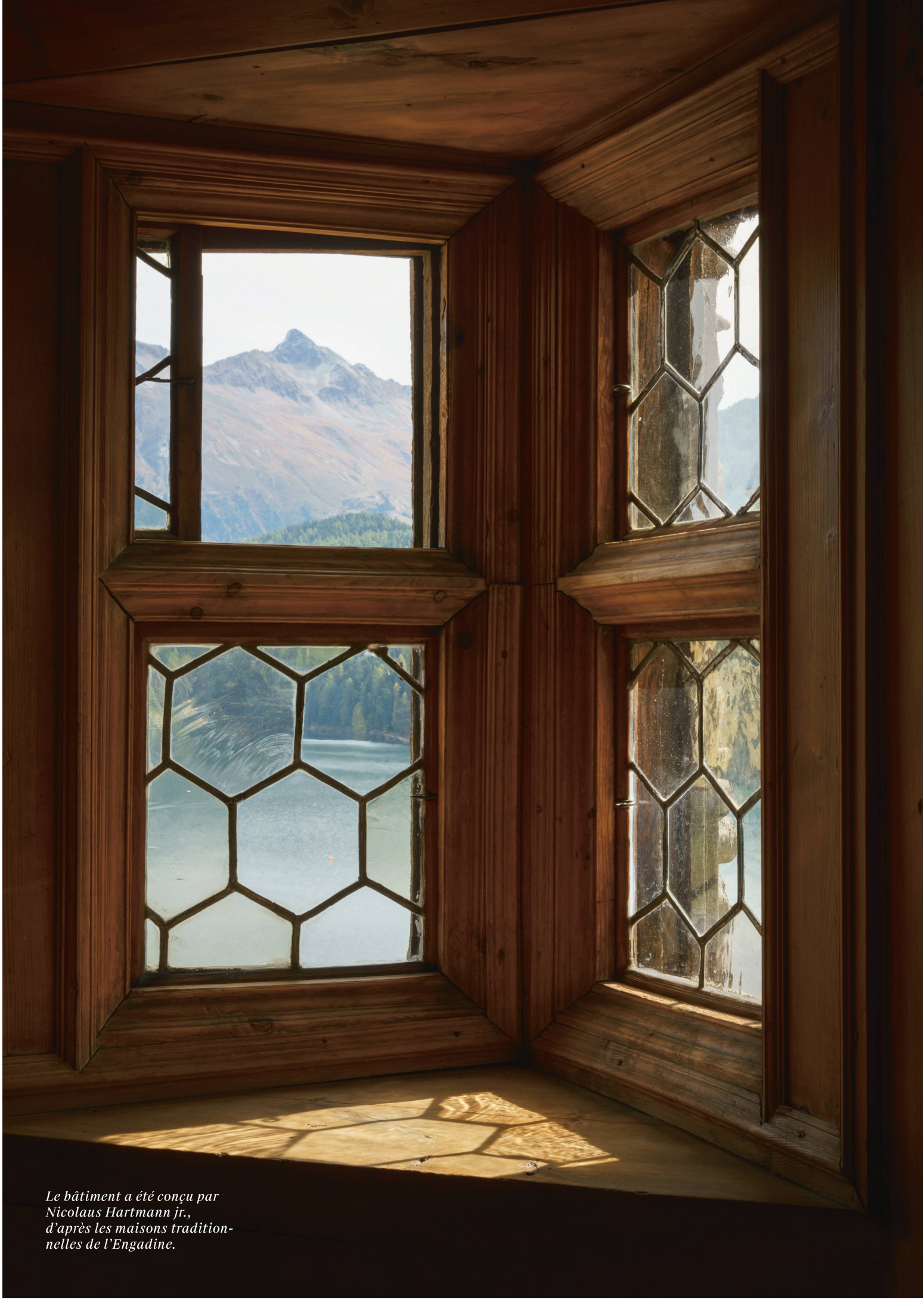
Le bâtiment a été conçu par Nicolaus Hartmann jr., d'après les maisons tradition- nelles de l'Engadine.