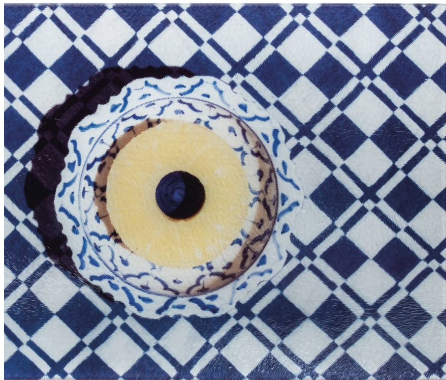
Planche à découper : Ananas Isabel Rotzler, verre, 28,5 x 20 cm / CHF 49

Capuchon : Beige 100 % mérinos, div. couleurs / CHF 125