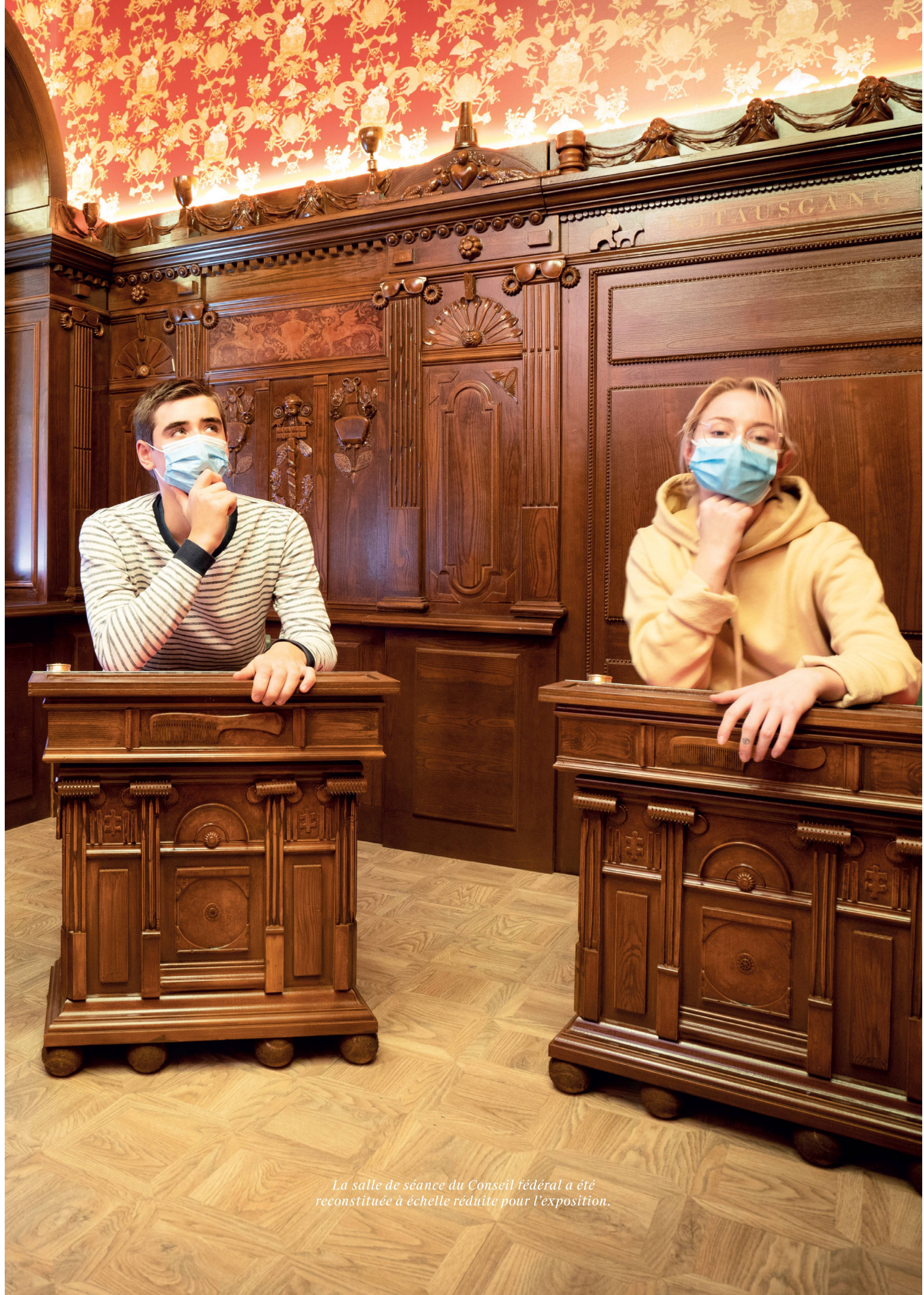
La salle de séance du Conseil fédéral a été reconstituée à échelle réduite pour l'exposition.