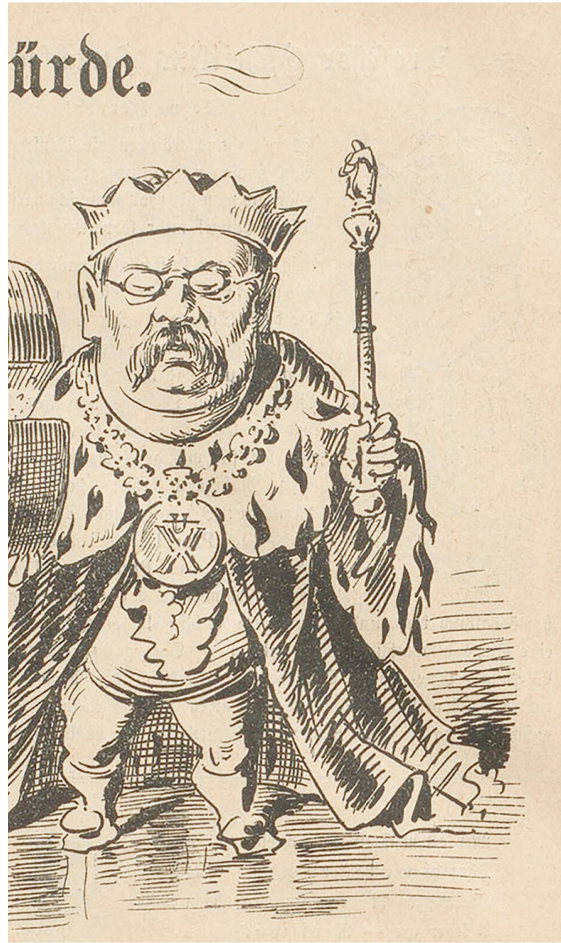
Le journal Nebelspalter a publié en 1880 des illustrations diffamatoires de Fridolin Anderwert.

lustrations diffamatoires. Des habitudes alimentaires du conseiller fédéral en surpoids aux rumeurs jamais avérées de fréquentation de maisons closes, tout fait l'objet d'articles de presse. L' Andelfinger Volksblatt et le journal bernois Tagwacht vont jusqu'à écrire le 25 décembre 1880: « Au nom de la vérité, il est de notre devoir d'affirmer que la fonction de président de la Confédération n'a jamais été occupée par un homme si moralement indigne qu'Anderwert. Son élection est une honte pour la Confédération tout entière. »