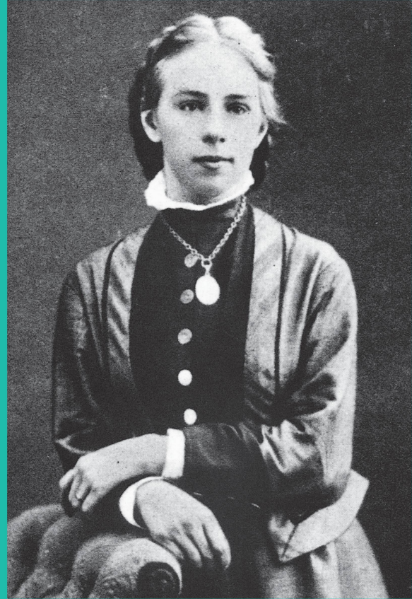
Emilie Kempin-Spyri, vers 1885.