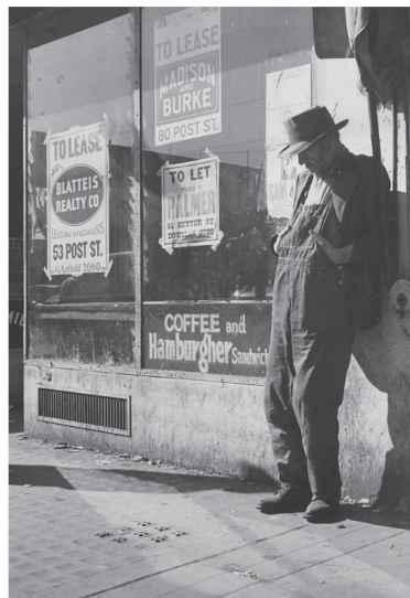
Chômeur lors de la Grande Dépression, image prise par Dorothea Lange, vers 1935.

Lorsque l'économie mondiale a basculé dans la grande crise