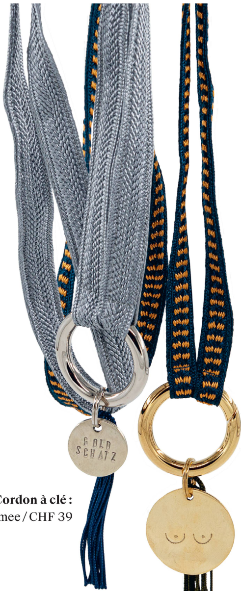
Cordon à clé: Yoomee / CHF 39