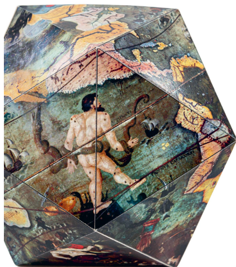
Maquette: Globe de Saint-Gall Zentralbibliothek Zürich / CHF 3