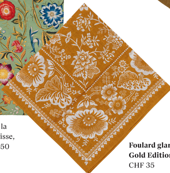
Foulard glaronnais : Gold Edition CHF 35