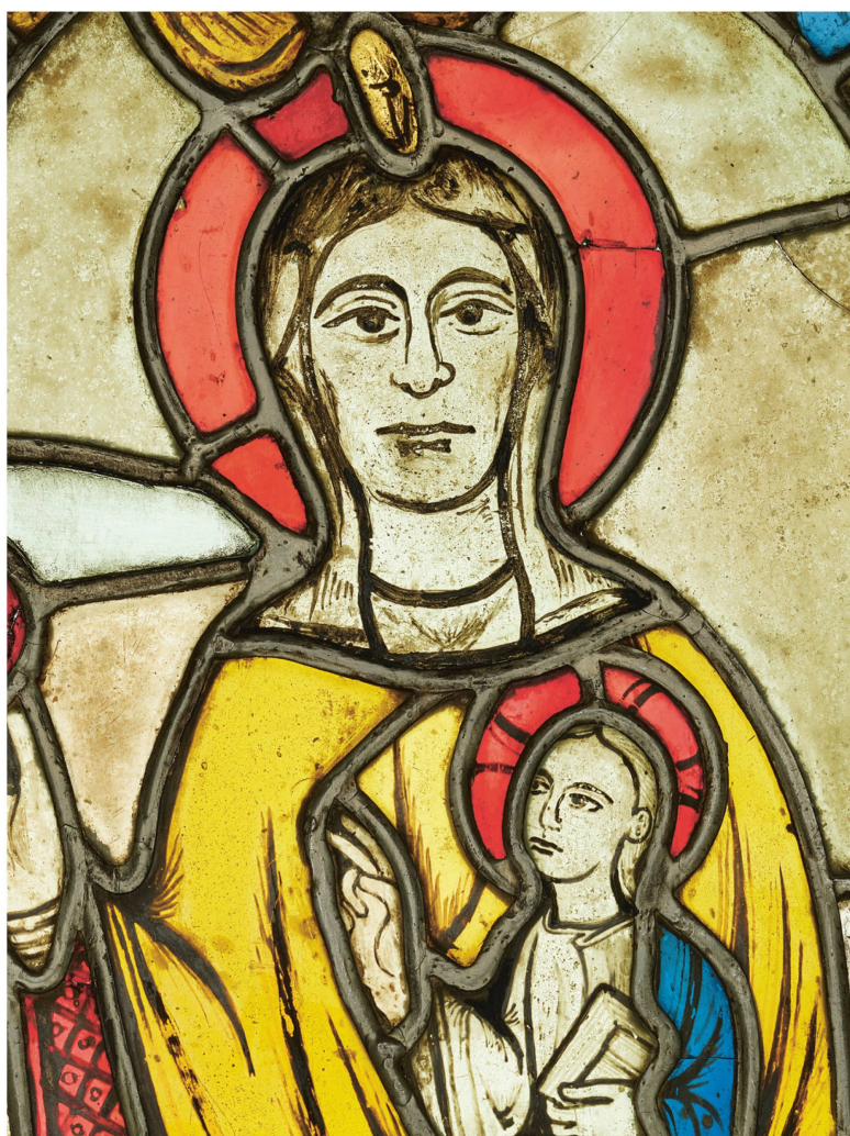
Vitrail datant du Moyen Âge : la Vierge à l'Enfant, aux alentours de 1200, chapelle de Saint-Jacques, à Gräpplang, Flums (SG).

Le vitrailliste travaille sur la base d'idées personnelles ou de modèles faits par d'autres artistes. Il élabore une maquette, qui est ensuite reportée sur un calque épais, le carton. Chaque pièce est dessinée et numérotée pour ne pas être confondue. Les « calibres » sont ensuite découpés à l'aide d'un ciseau spécial qui retire des bandes de 1,5 millimètre de large entre les morceaux. C'est dans cet espace que le sertissage en plomb, qui constitue le cadre si caractéristique des vitraux, prend place.