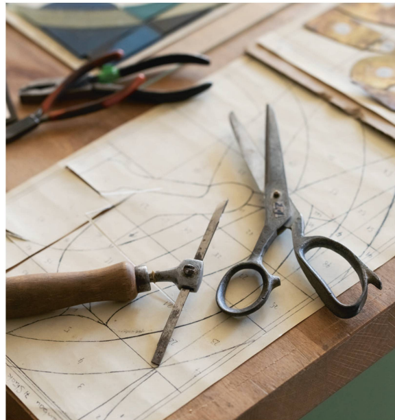
Couteau et ciseau spécial.

Une fois les calibres découpés, le vitrailliste a l'embarras du choix entre plus de 5000 coloris. Pour chaque pièce, il choisit le verre qui convient, comme un peintre choisit ses couleurs. Il ne les fabrique pas lui-même, mais les achète à une verrerie.