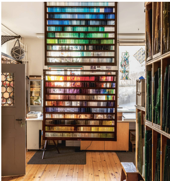
Le nuancier du vitrailliste recense près de 800 coloris.