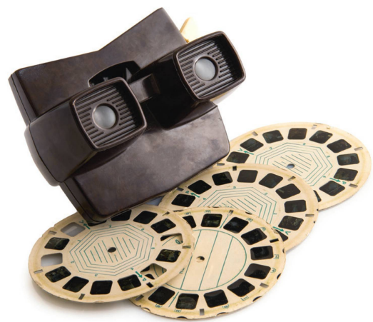
La visionneuse View-Master a conquis les chambres d'enfant dès 1939.

Très vite après son invention, la stéréoscopie, main dans la main avec la photographie mise au point seulement un an plus tard, se mue en un média de masse qui conquiert la planète. Cette ascension est principalement le fait d'éditeurs