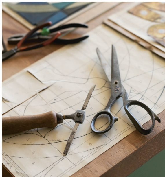
Couteau et ciseau spécial.

Une fois les calibres découpés, le vitrailliste a l'embarras du choix entre plus de 5000 coloris. Pour chaque pièce, il choisit le verre qui convient, comme un peintre choisit ses couleurs. Il ne les fabrique pas lui-même, mais les achète à une verrerie.