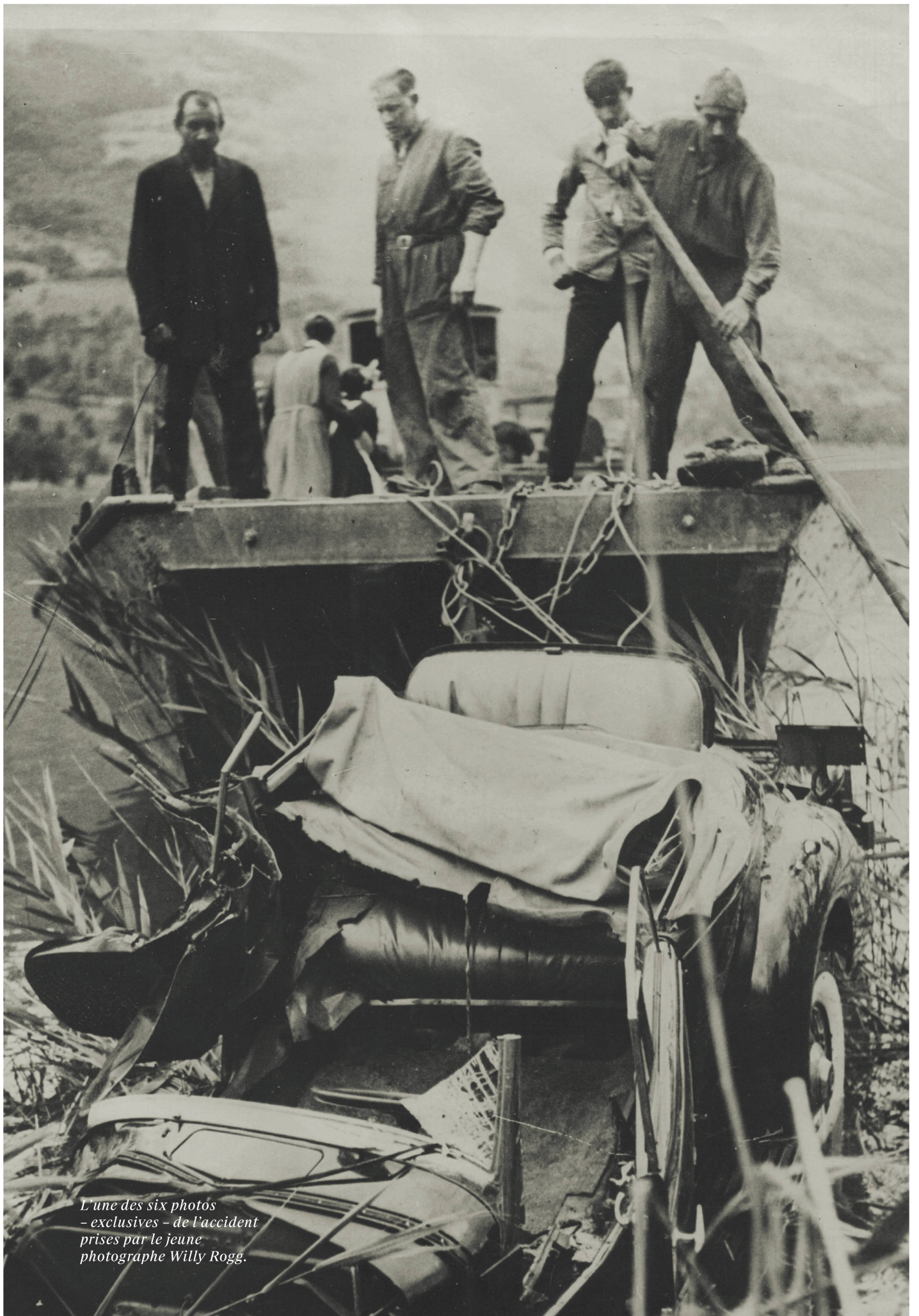
L'une des six photos - exclusives - de l'accident prises par le jeune photographe Willy Rogg.