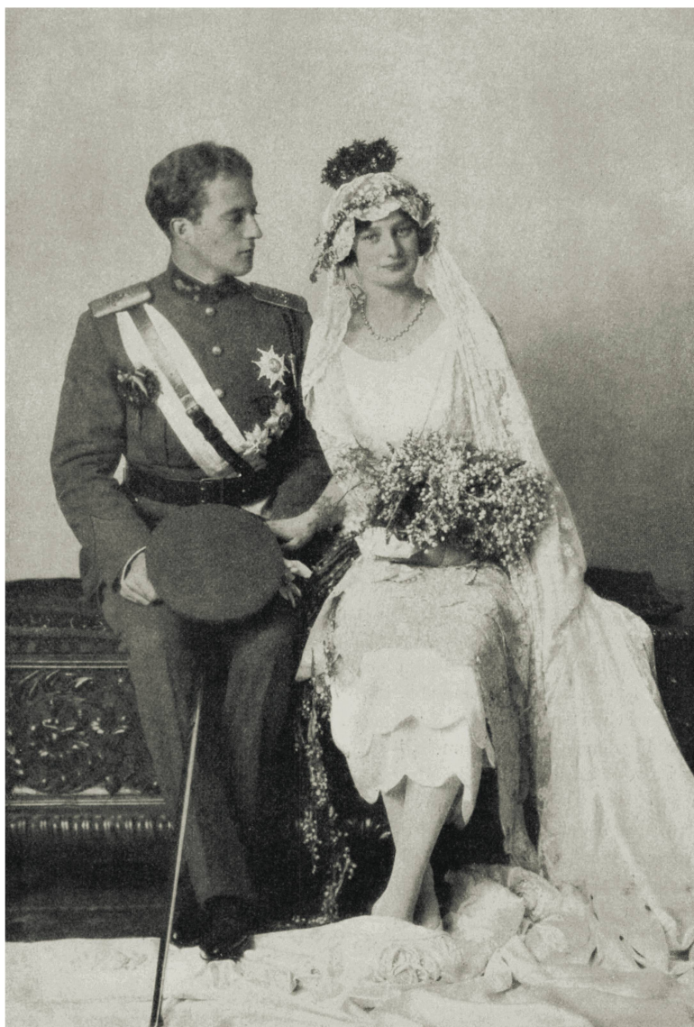
En 1926, Léopold III de Belgique épouse la jeune Astrid de Suède, 19 ans.