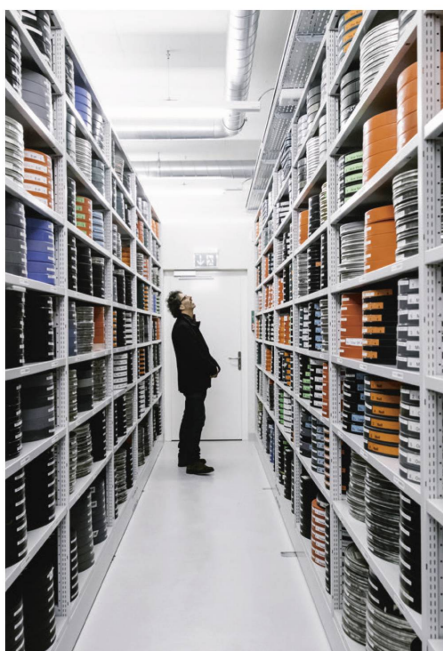
Au cœur des archives de la Cinémathèque suisse.

fique édifice construit en 1908, rénové et transformé pour l'occasion, le Casino de Montbenon. La Cinémathèque suisse peut enfin y déployer une programmation quotidienne de 3 projections, tous les jours et